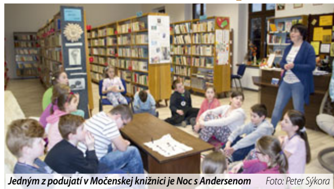
Jedným z podujatí v Močenskej knižnici je Noc s Andersenom

Čitatelia do močenskej knižnice nechodia iba v marci, ale navštevujú ju počas celého roka. Množstvo dospelých i mladých ľudí prichádza do knižnice každodenne. Požičiavajú si tu knihy alebo si čítajú nové vydania časopisov. Častými návštevníkmi knižnice sú deti. „Veľmi rada čítam, požičiavam si knihy z knižnice alebo mi mama kupuje. Najradšej čítam knihy od Roalda Dahla,