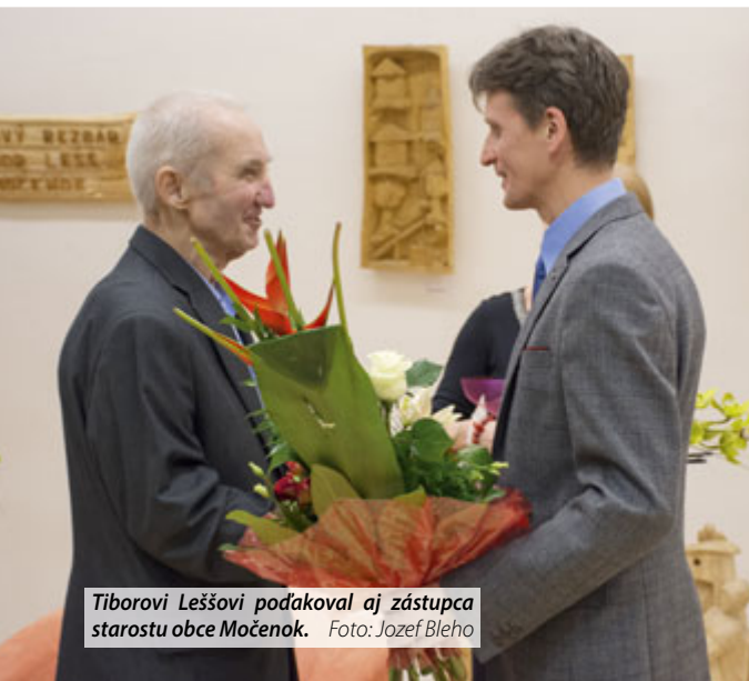
Tiborovi Lešovi poďakoval aj zástupca starostu obce Močenok.