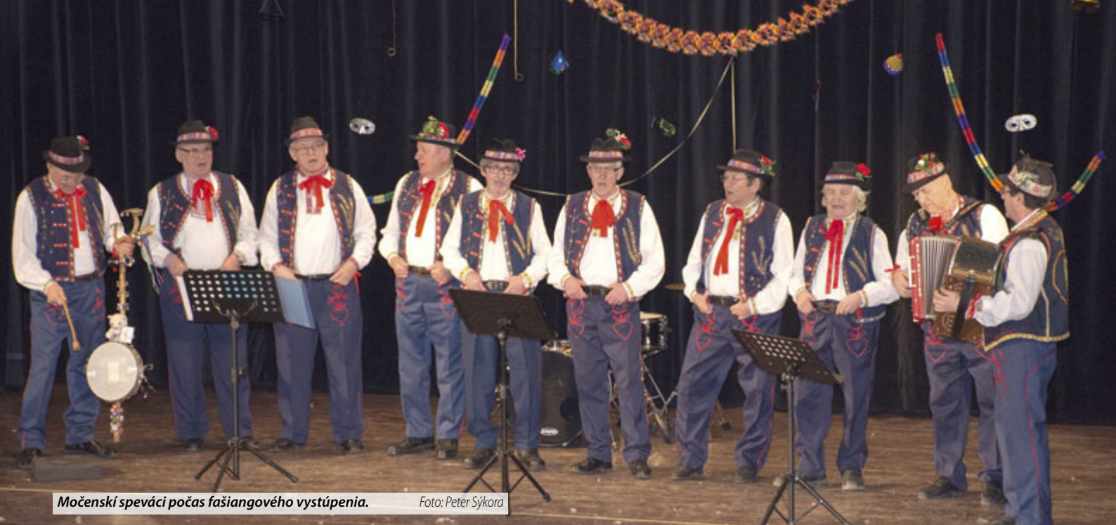
Močenski speváci počas fašiangového vystúpenia.