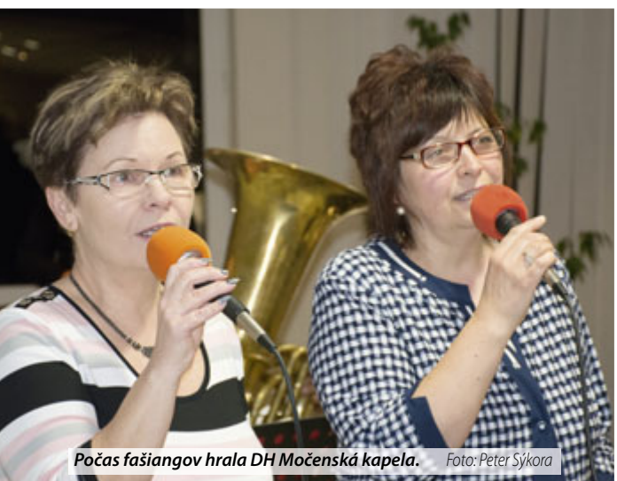
Počas fašiangov hrala DH Močenská kapela.