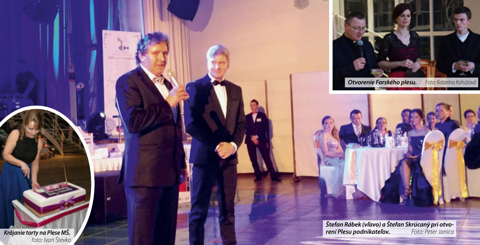
Otvorenie Farského plesu.