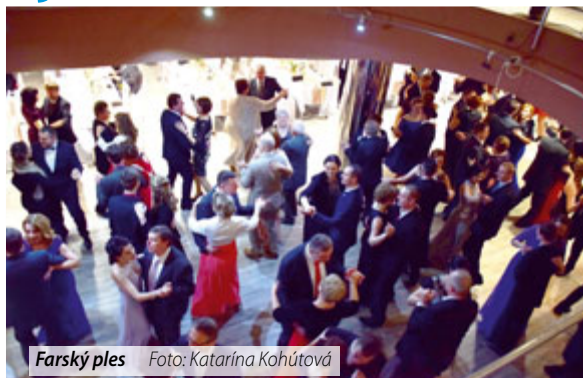
Farský ples