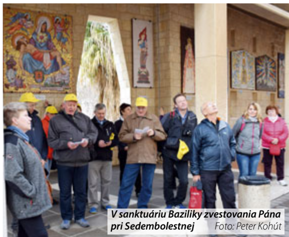
V sanktuáriu Baziliky zvestovania Pána pri Sedembolestnej

Stúj, noho! Posvätná miesta jsou, kamkoli kráčiš... /J.Kollár: Slavy dcera, úryvok/.