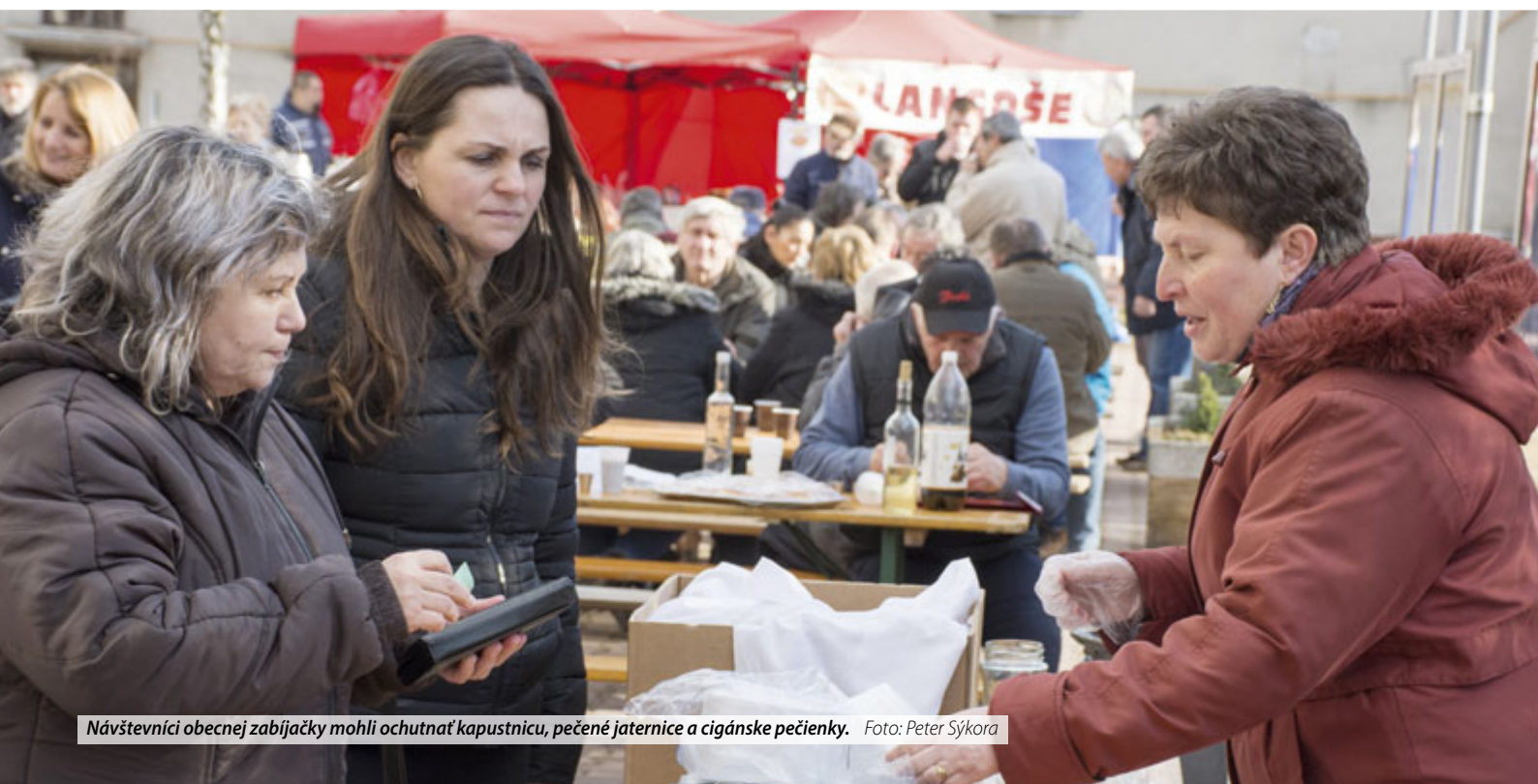
Návštevníci obecnej zabijačky mohli ochutnať kapustnicu, pečené jaternice a cigánske pečienky.