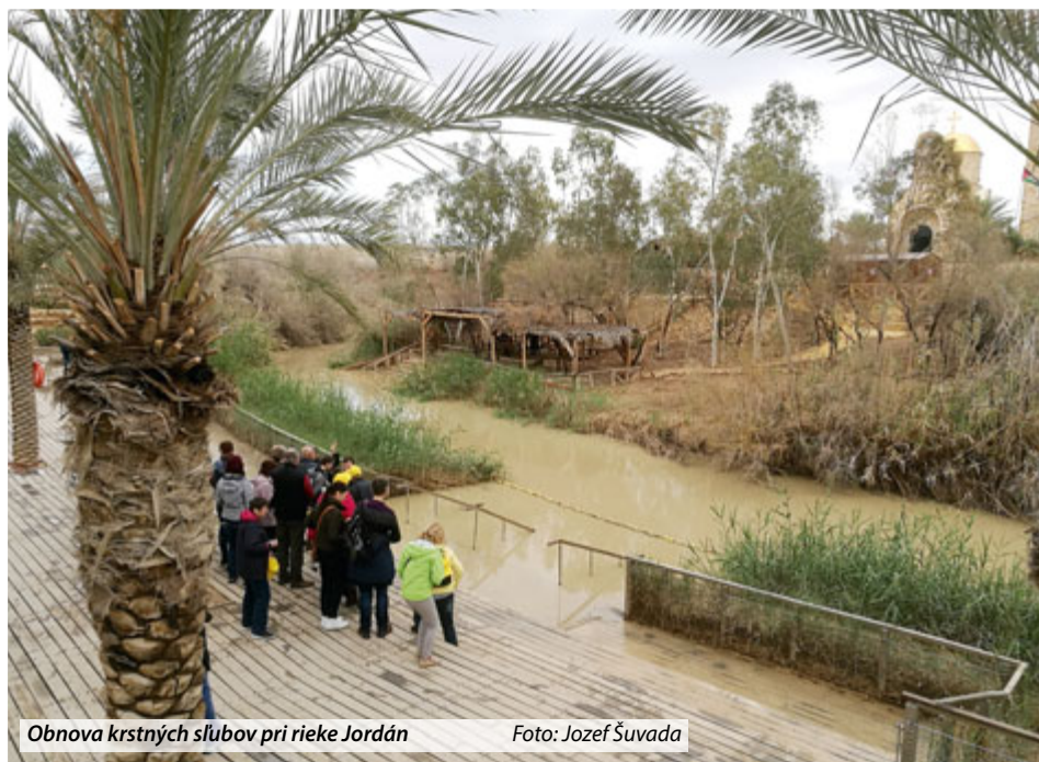
Obnova krstných slúbov pri rieke Jordán