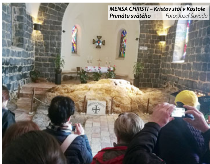
MENSA CHRISTI – Kristov stôl v Kostole Primátu svätého

VIA DOLOROSA (Cesta utrpenia) – krížová cesta. Via Dolorosa symbolizuje poslednú cestu Ježiša od miesta obžaloby až po miesto ukrižovania – z pevnosti Antónia až na Kalváriu – Golgotu. Viedla úzkymi ulicami starého mesta Jeruzalema za kriku predavačov a trhovníkov ponúkajúcich svoj tovar. Potrebovali sme veľkú dávku sústredenia, aby sme vládali sledovať dej krížovej cesty, ktorá bola obetovaná za kňazov. Jednotlivé zastavenia boli označené kaplnkami (Kaplnka odsúdenia, Kaplnka bičovania, Kaplnka arménskych katolíkov, Kostol Panny Márie Bolestnej, Františkánska kaplnka, Kostol svätej Veroniky) alebo nápismi na múroch. Päť zastavení bolo v Bazilike Božieho hrobu.