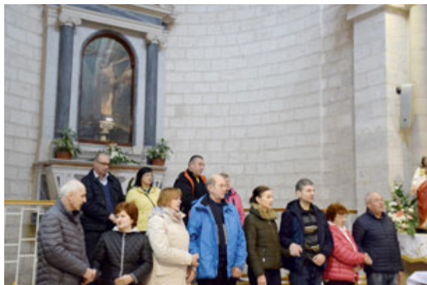
Obnova manželských sľubov v Kostole zázraku premenenia vína v Káne