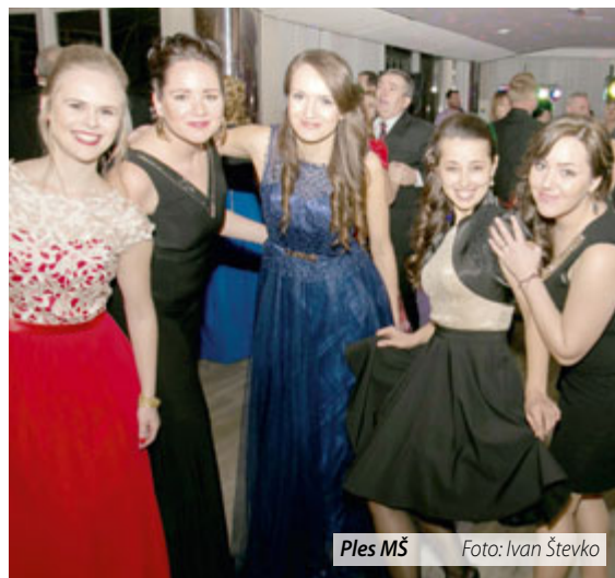
Ples MŠ