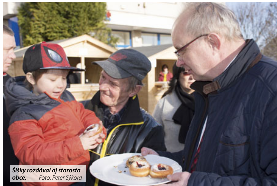
Šišky rozdával aj starosta obce.