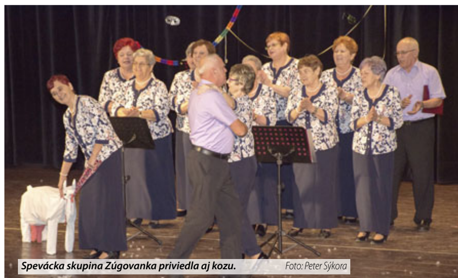
Spevácka skupina Zúgovanka priviedla aj kozu.