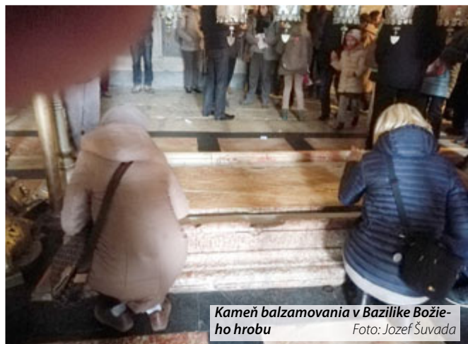
Kameň balzamovania v Bazilike Božieho hrobu