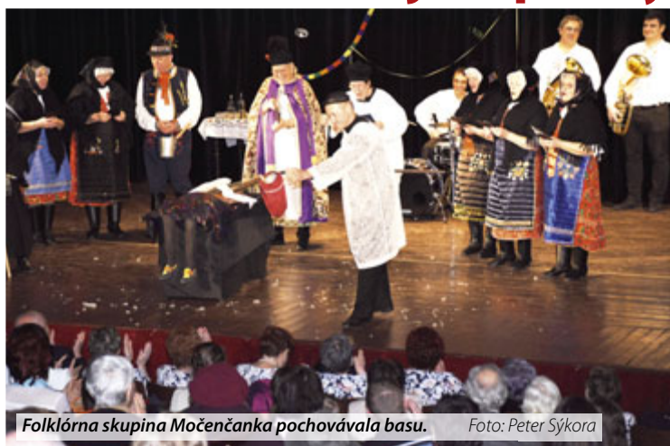
Folklorná skupina Močenčanka pochovávala basu.

Obyvatelia Močenka sa rozlúčili s fašiangami v nedeľu 26. februára 2017. V kultúrnom dome sa v tento deň konalo fašiangové popoludnie. Domáce umelecké