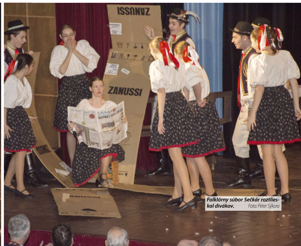
Folklorný súbor Sečkár roztlieskal divákov.