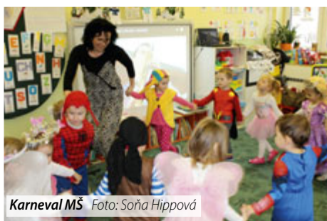
Karneval MŠ