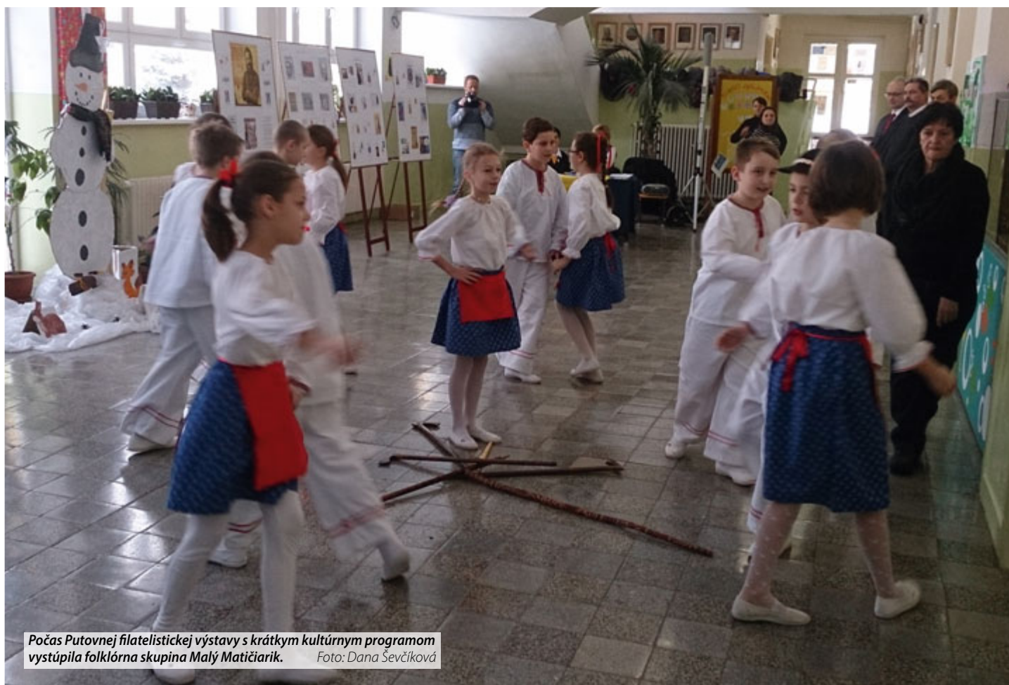
Počas Putovnej filatelistickej výstavy s krátkym kultúrnym programom vystúpila folklórna skupina Malý Matičiarik.