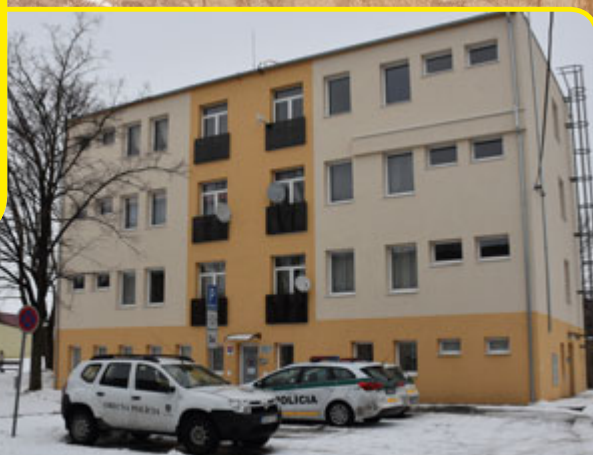
Štátna i obecná polícia už sídli v polyfunkčnom objekte.