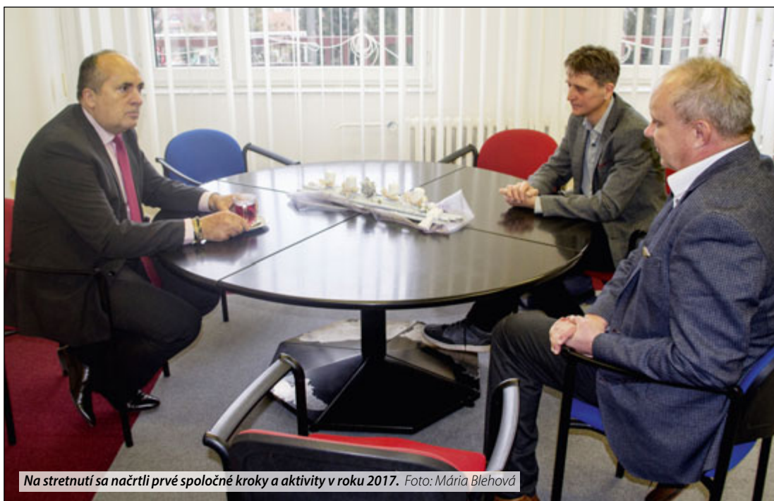
Na stretnutí sa načrtli prvé spoločné kroky a aktivity v roku 2017.