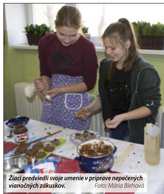
Žiaci predviedli svoje umenie v príprave nepéčených vianočných zákuskov.