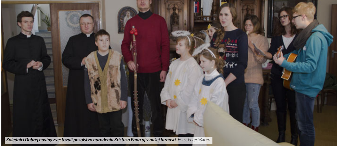
Koledníci Dobrej noviny zvestovali posolstvo narodenia Kristusa Pána aj v našej farnosti.

„Ty ma budeš sprevádzať, ale ja poznám cestu,“ znela odpoveď jedného z našich najmenších koledníkov. V týchto slovách je skutočná podstata, a to vyjadrená obyčajným detským neopakovateľným zmyslaním. Poznali cestu. Všetkých tridsať poslov detskej radosti so svojimi sprevádzajúcimi osobami poznali tú správnu cestu. Cestu, ktorá sa začala pred vyše dvoma desaťročiami ako malá a nsmelá myšlienka a postupne sa rozrástla na jednu z najväčších humanitárnych zbierok na Slovensku: DOBRÁ NOVINA. Je to cesta prinášajúca požehnanie a radosť, ktorá nás učí spolupatričnosti, zodpovednosti a lásky.