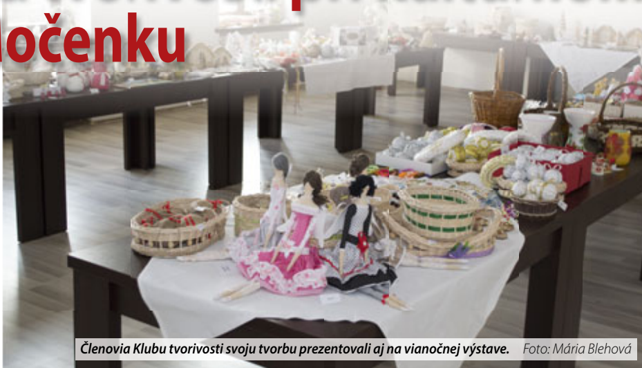
Členovia Klubu tvorivosti svoju tvorbu prezentovali aj na vianočnej výstave.

Úzko spolupracujeme aj s Krajským osvetovým strediskom v Nitre, kde tieto členky pracovali ako lektorky: Mária Dič-