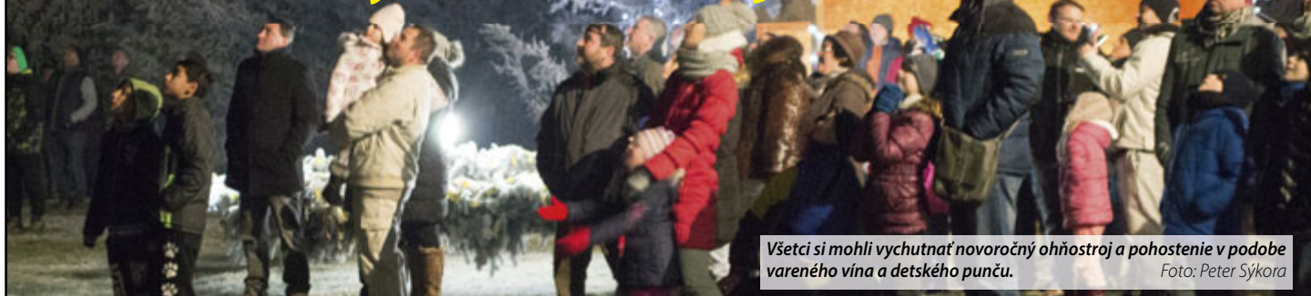
Všetci si mohli vychutnať novoročný ohňostroja pohostenie v podobe vareného vína a detského punču.