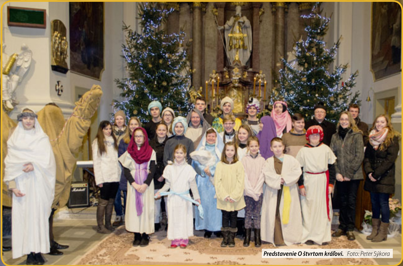
Predstavenie O štvrtom kráľovi.