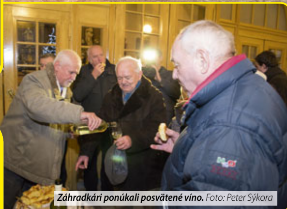
Záhradkári ponúkali posvätené víno.