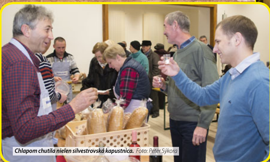
Chlapom chutila nielen silvestrovská kapustnica.