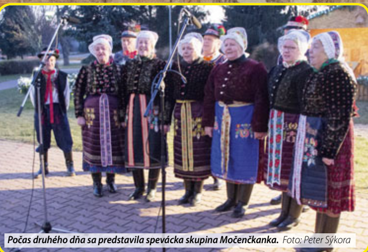
Počas druhého dňa sa predstavila spevácka skupina Močenčkanka.