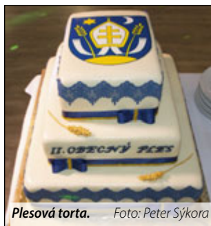
Plesová torta.