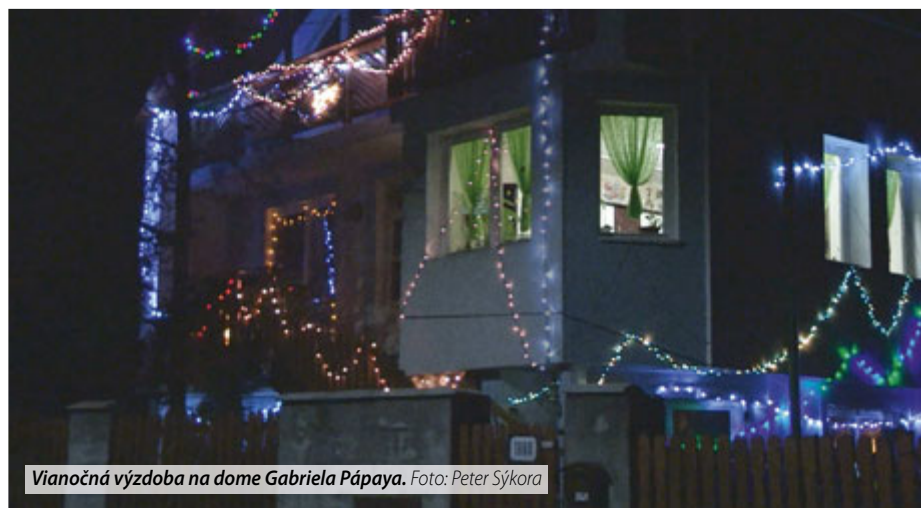
Vianočná výzdoba na dome Gabriela Pápaya.