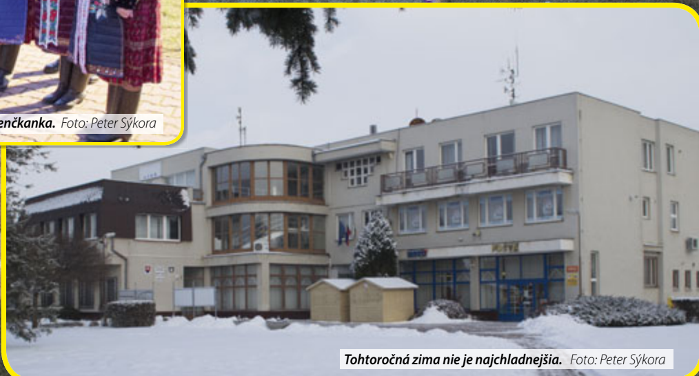
Tohtoročná zima nie je najchladnejšia.