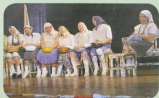
DS Dino z Hornej Stredy