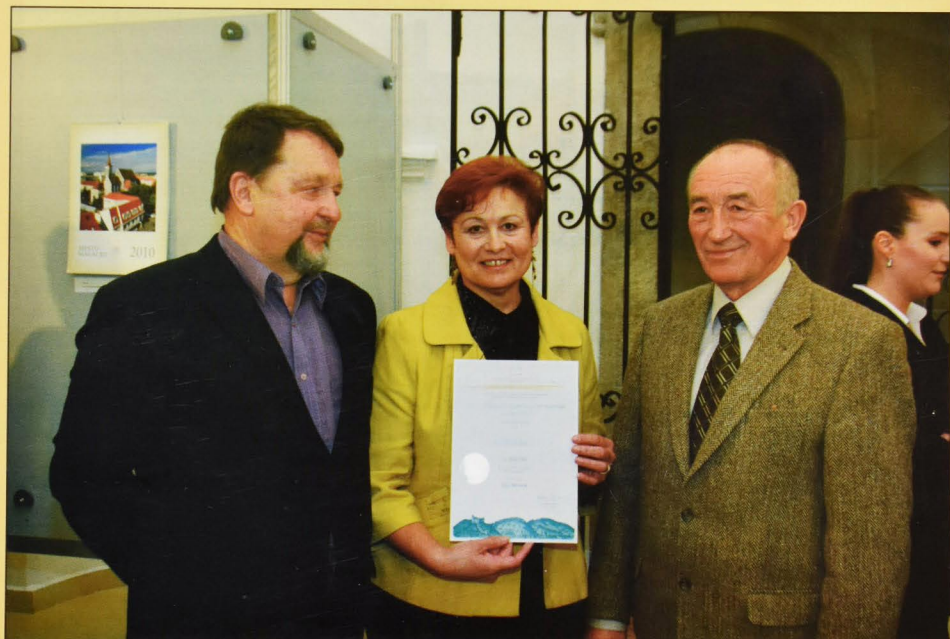
Ocenená močenská kniha