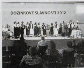
DOŽINKOVÉ SLÁVNOSTI 2012

Veľtrh, ktorý prebiehal v dňoch od 23. do 26. Augusta, ponúkal návštevníkom množstvo vystavovaných expozícií cez národnú výstavu hospodárskych zvierat, ukážky z regiónov Slovenska, nechýbali ani konferencie a informačné semináre pre poľnohospodárov, potravinárov a lesníkov či živnostenského trhu. Počas neho zároveň prebiehal bohatý kultúrny program na niekoľkých miestach v areáli výstavniska, ktorý pozostával z vystúpení dychových hudieb, speváckych skupín či folklórnych súborov. So svojim pásmom sa predstavila aj folklórna skupina Močenčanka.