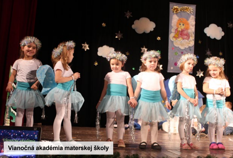
Vianočná akadémia materskej školy