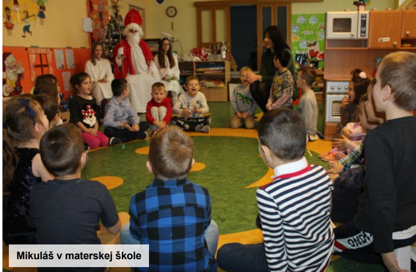
Mikuláš v materskej škole