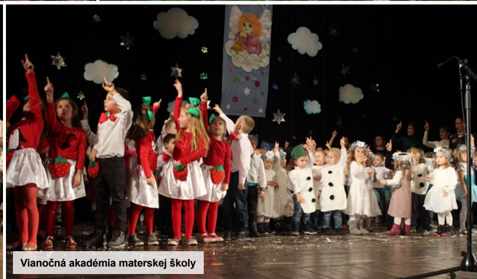
Vianočná akadémia materskej školy