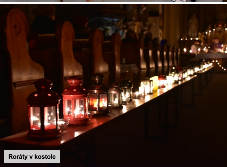
Roráty v kostole