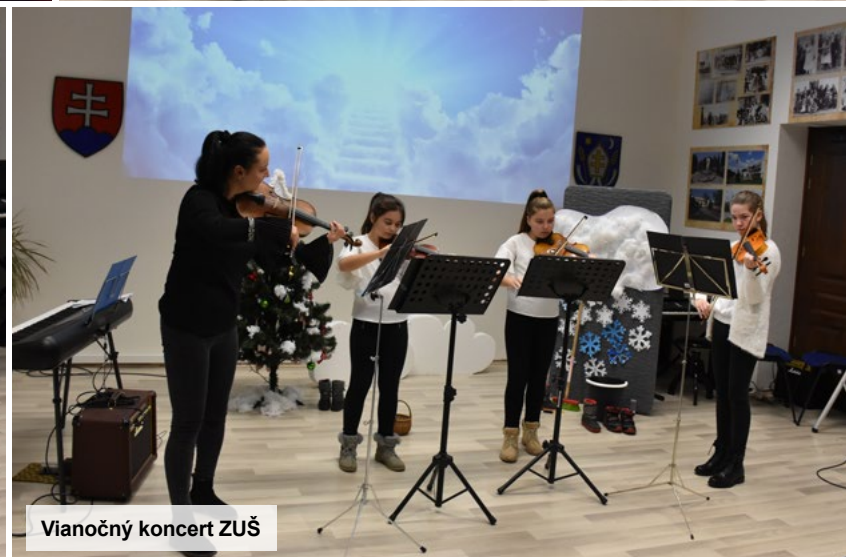
Vianočný koncert ZUŠ