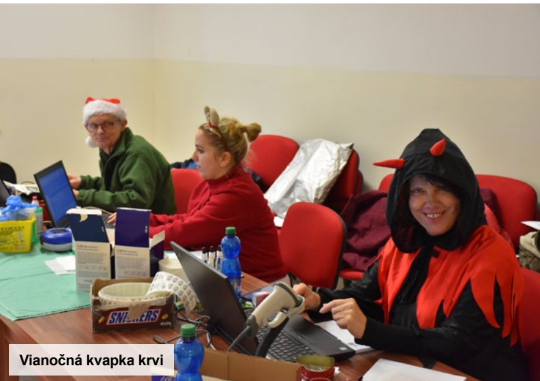
Vianočná kvapka krvi