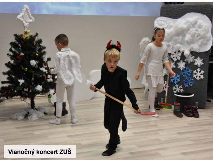
Vianočný koncert ZUŠ