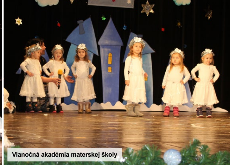
Vianočná akadémia materskej školy