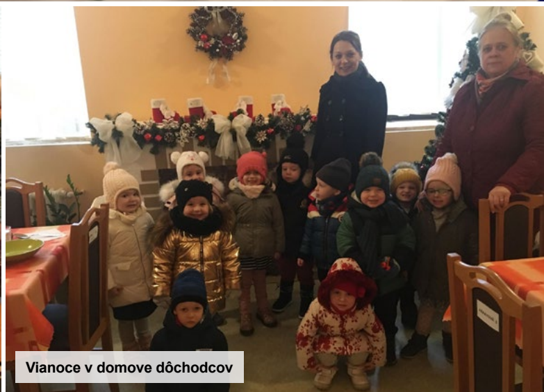
Vianoce v domove dôchodcov