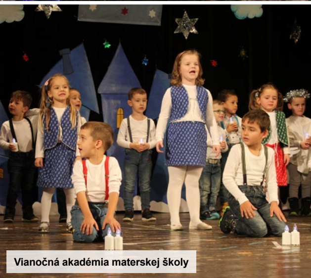
Vianočná akadémia materskej školy