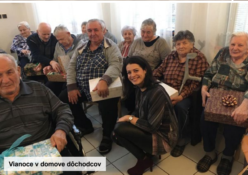
Vianoce v domove dôchodcov