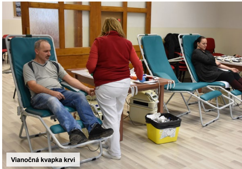
Vianočná kvapka krvi