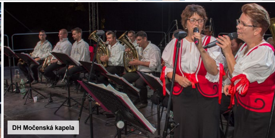
DH Močenská kapela