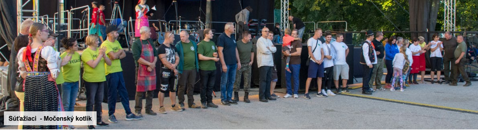
Súťažiaci - Močenský kotlík