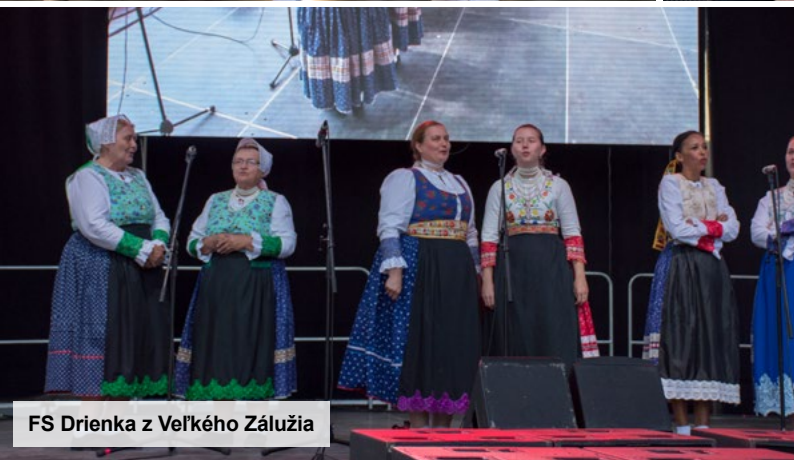
FS Drienka z Veľkého Zálužia