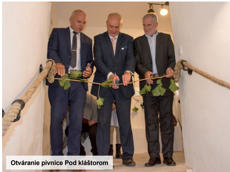
Otváranie pivnice Pod kláštorom