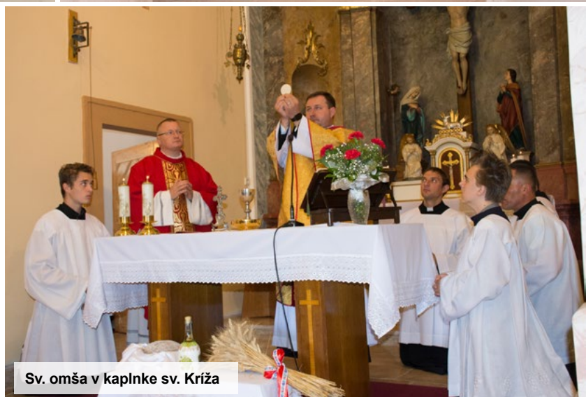
Sv. omša v kaplnke sv. Kríža