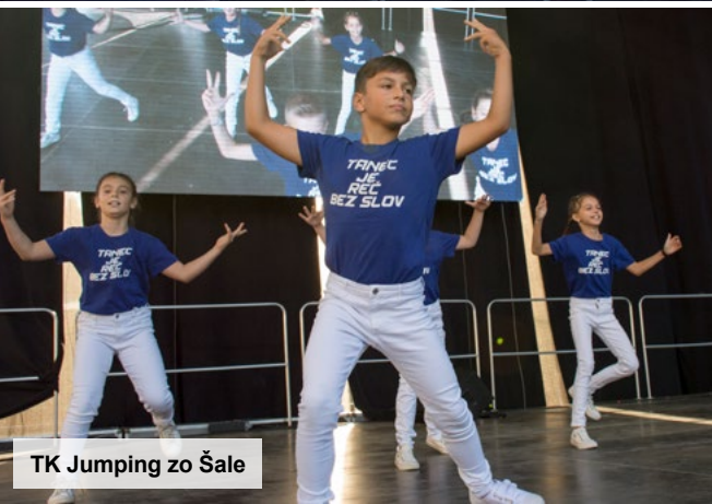
TK Jumping zo Šale