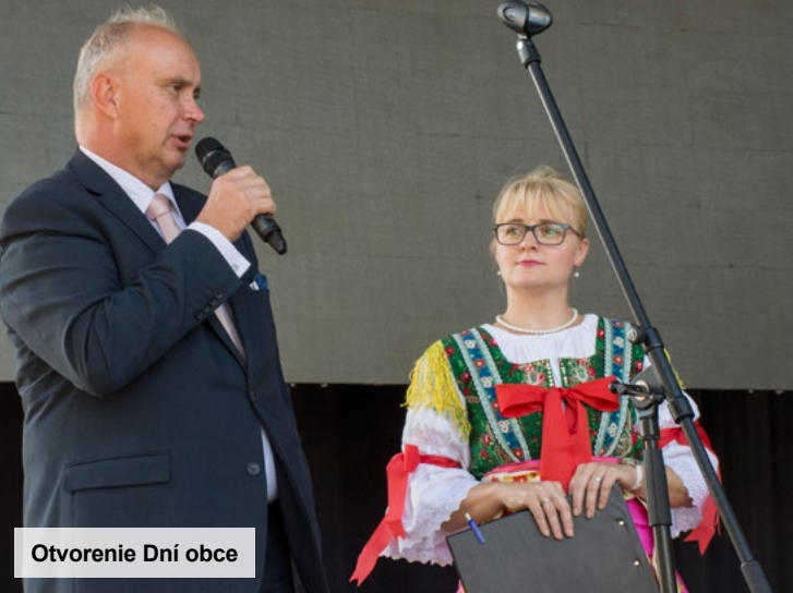
Otvorenie Dní obce