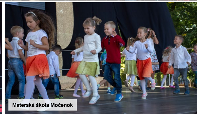
Materská škola Močenok