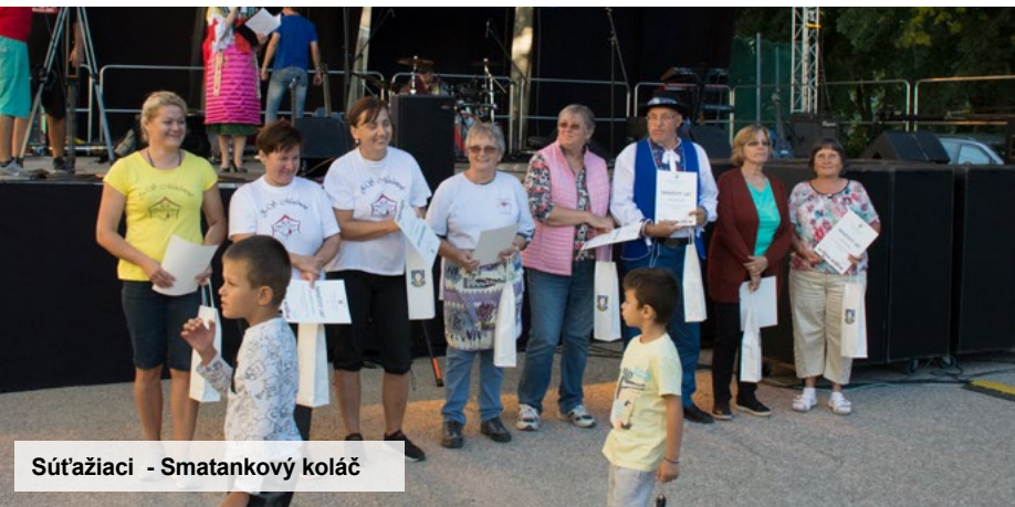
Súťažiaci - Smatankový koláč