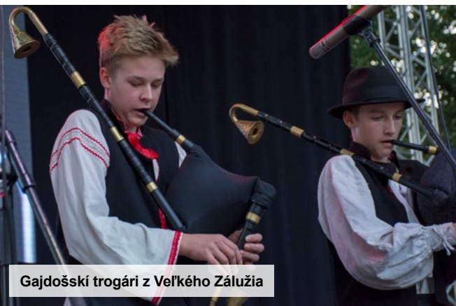
Gajdošský trogári z Veľkého Zálužia