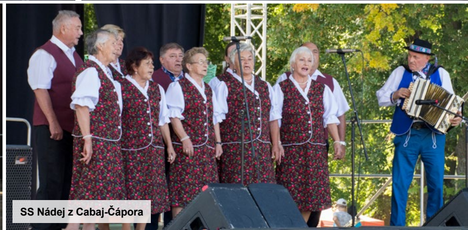
SS Nádej z Cabaj-Čápora