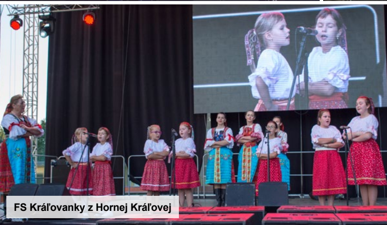
FS Kráľovanky z Hornej Kráľovej