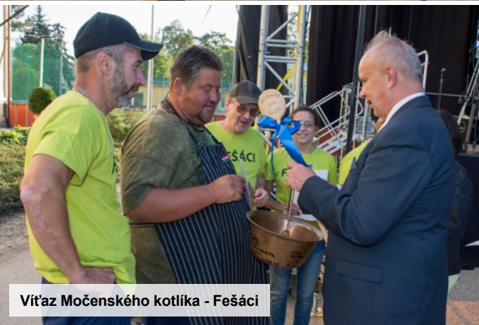
Víťaz Močenského kotlíka - Fešáci