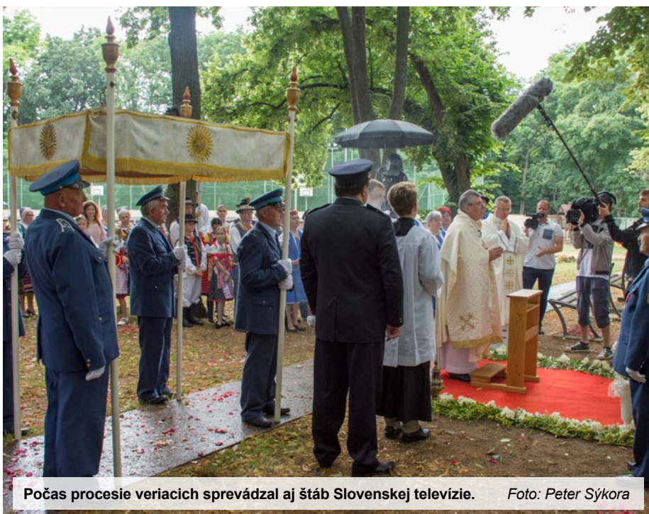
Počas procesie veriacich sprevádzal aj štáb Slovenskej televízie.

Táto mníška venovala všetok svoj voľný čas návšteve a poklone Oltárnej sviatosti v kostole. Niekoľko ráz vo vytržení videla jasný mesiac s tmavým pruhom. Sám Spasiteľ ju poučil, že toto