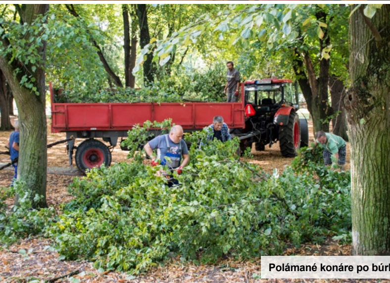
Polámané konáre po búrke z parku odstraňovali pracovníci hospodárskeho dvora.