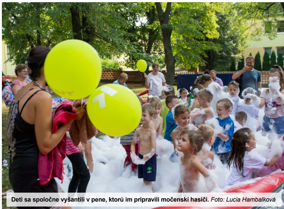
Deti sa spoločne vyšantili v pene, ktorú im pripravili močenski hasiči.