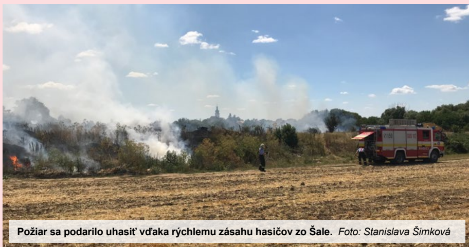
Požiar sa podarilo uhasiť vďaka rýchlejšiemu zásahu hasičov zo Šale.

Vypaľovanie porastov je prísne zakázané! V prípade, že už občan spaľuje horľavé látky, mal by okolie ohniska zbaviť horľavých látok, aby nedošlo vplyvom klimatických podmienok k jeho rozšíreniu.