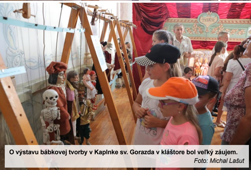
O výstavu bábkovej tvorby v Kaplnke sv. Gorazda v kláštore bol veľký záujem.