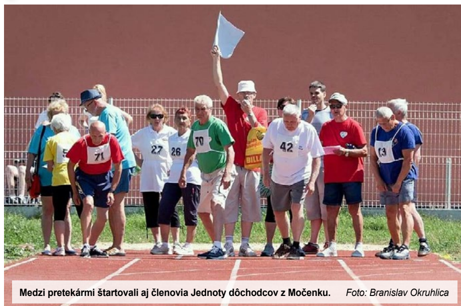
Medzi pretekármi štartovali aj členovia Jednoty dôchodcov z Močenku.

4. júla 2019 sa v Šali konali Krajské športové hry seniorov o „Putovný pohár predsedu NSK“ pod záštitou Milana Belicu, predsedu Nitrianskeho samo-