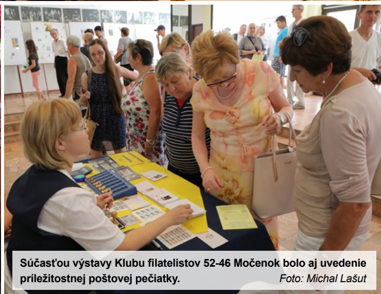
Súčasťou výstavy Klubu filatelistov 52-46 Močenok bolo aj uvedenie príležitostnej poštovej pečiatky.