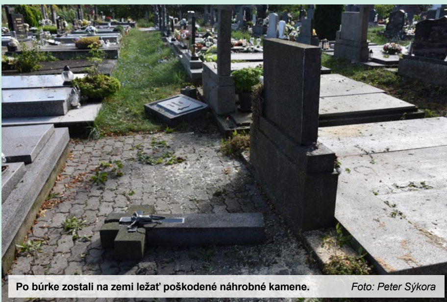
Po búrke zostali na zemi ležať poškodené náhrobné kamene.