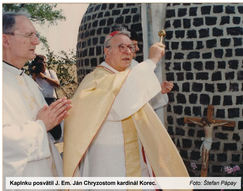
Kaplnku posvätil J. Em. Ján Chryzostom kardinál Korec.