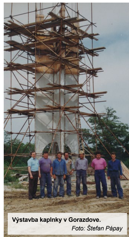
Výstavba kaplnky v Gorazdove.