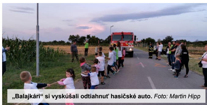
„Balajkári“ si vyskúšali odtiahnuť hasičské auto.