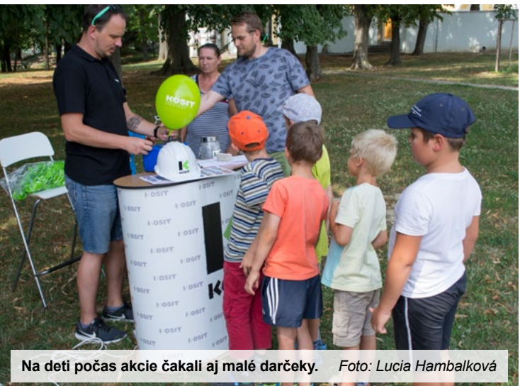
Na deti počas akcie čakali aj malé darčeky.