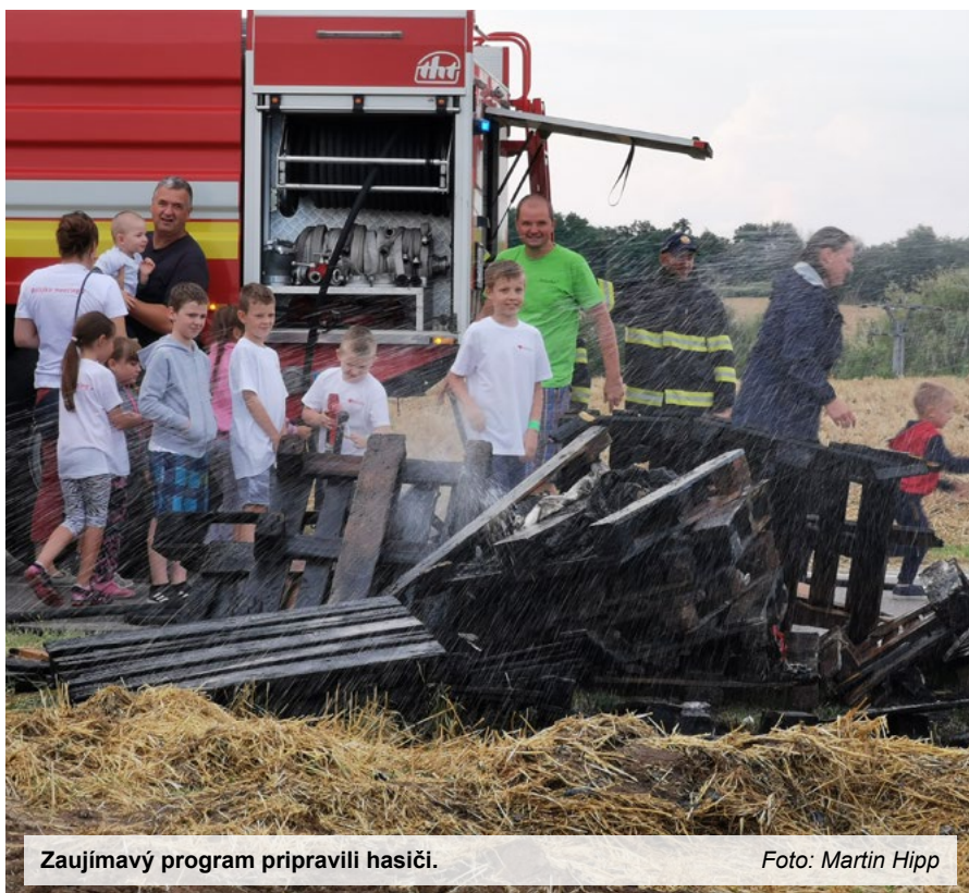
Zaujímavý program pripravili hasiči.