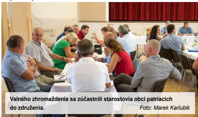
Valného zhromaždenia sa zúčastnili starostovia obcí patriacich do združenia.