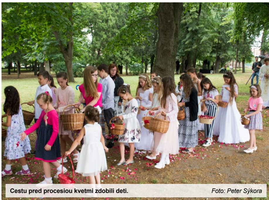
Cestu pred procesiou kvetmi zdobili deti.