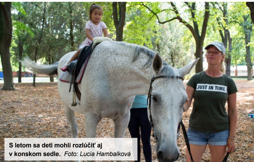
S letom sa deti mohli rozlúčiť aj v konskom sedle.