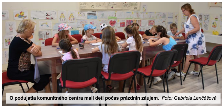
O podujatia komunitného centra mali deti počas prázdnin záujem.