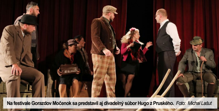
Na festivale Gorazdov Močenok sa predstavil aj divadelný súbor Hugo z Pruského.