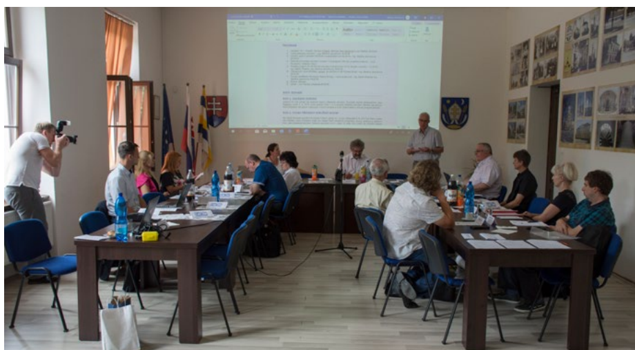
Európska kultúrna cesta mala valné zhromaždenie v Močenku.