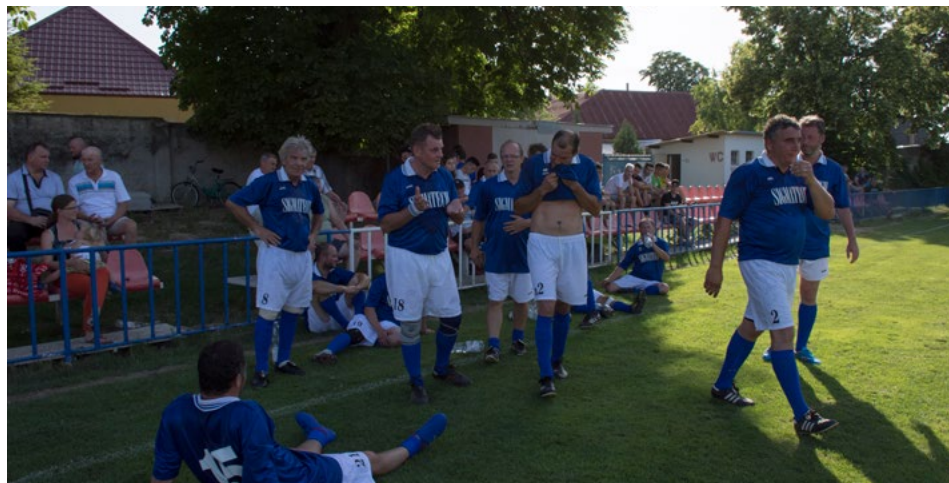
Viaceri z ocenených bývalých futbalistov oprášili po slávnostnej dekorácii kopačky a po rokoch sa predviedli pred domácim publikom.