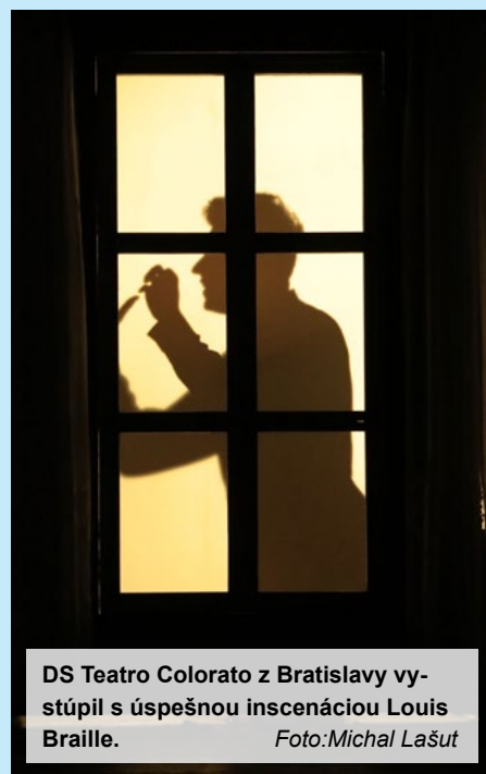
DS Teatro Colorato z Bratislavy vystúpil s úspešnou inscenáciou Louis Braille.

(text je uverejnený s povolením redakcie Katolíckych novín, v ktorých bol publikovaný)