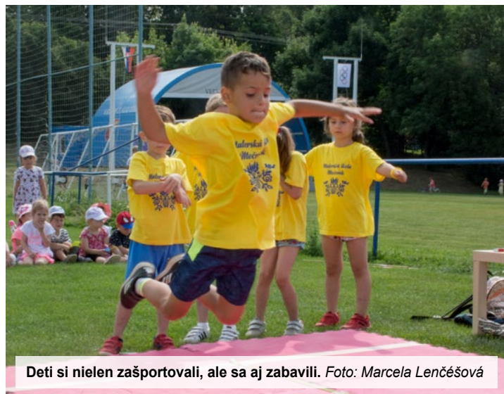
Deti si nielen zašportovali, ale sa aj zabavili.