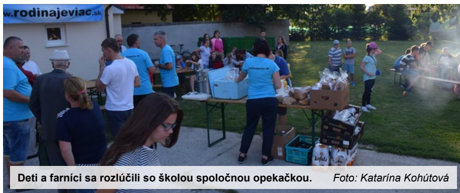
Deti a farníci sa rozlúčili so školou spoločnou opekačkou.