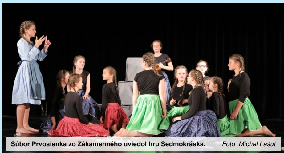
Súbor Prvosienka zo Zákamenného uviedol hru Sedmokráska.