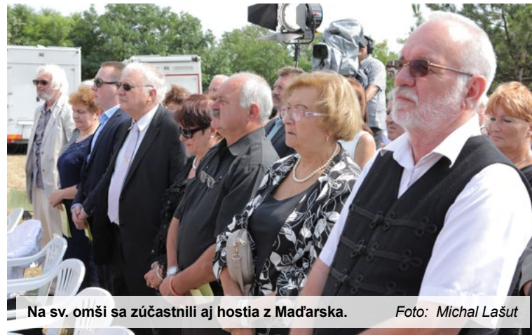
Na sv. omši sa zúčastnili aj hostia z Maďarska.