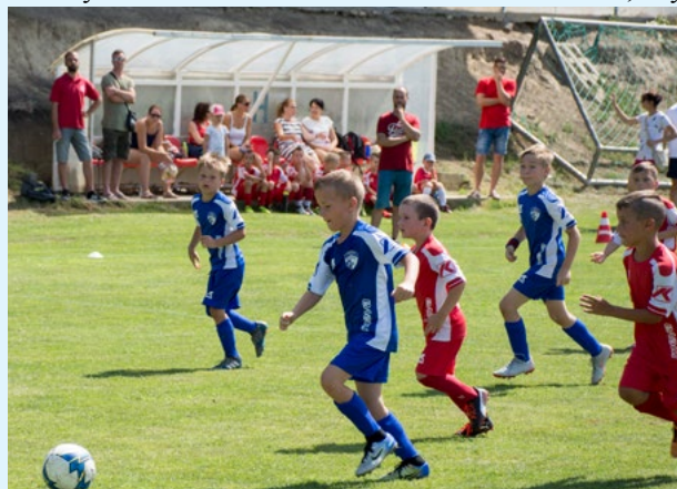
Po trávniku sa prehnali aj prípravkari.

V náročnejšej pozícii boli práve hádzanárske, pretože namiesto hádzanej museli hrať futbal. O víťazstvo v tomto zápase ani tak nešlo. Zámerom bolo skôr to, aby