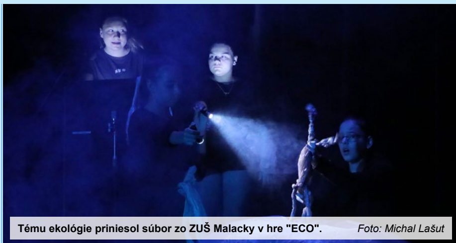
Tému ekológie priniesol súbor zo ZUŠ Malacky v hre "ECO".