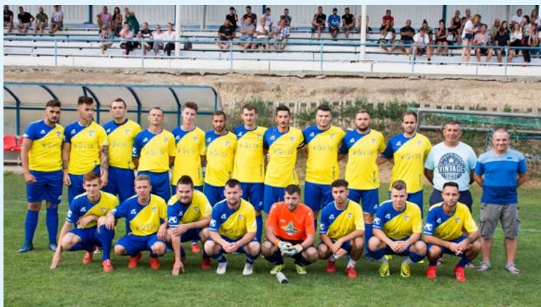
Domáci kolektív skončil na turnaji strieborný.