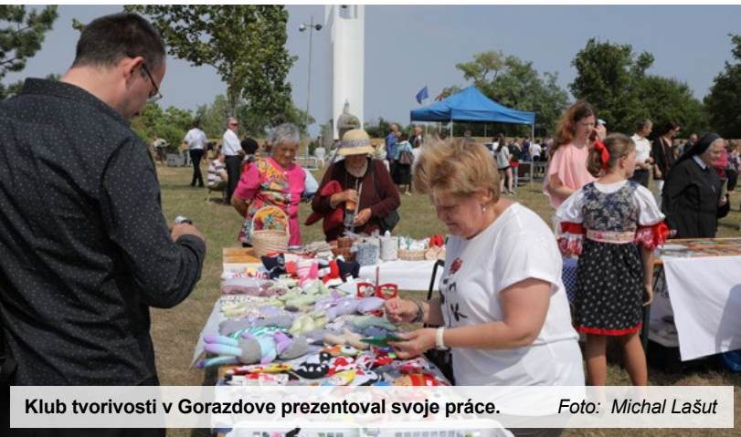
Klub tvorivosti v Gorazdove prezentoval svoje práce.