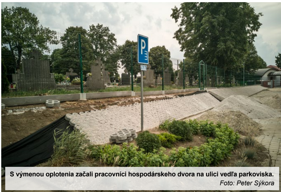
S výmenou oplotenia začali pracovníci hospodárskeho dvora na ulici vedľa parkoviska.