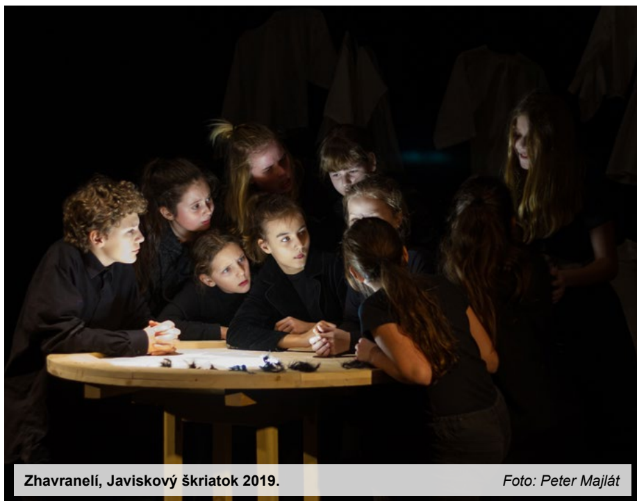
Zhavranelí, Javiskový škriatok 2019.