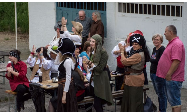
Piráti prišli povzbudzovať močenských futbalistov. Tí, možno zo strachu, že im piráti vyjedia či skôr vypijú zásoby, ktoré majú odložené v bufete, nakoniec vyhrali.