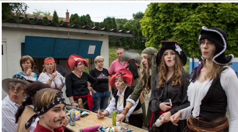
že im piráti vyjedia či skôr vypijú zásoby, ktoré majú odložené v bufete, nakoniec vyhrali.