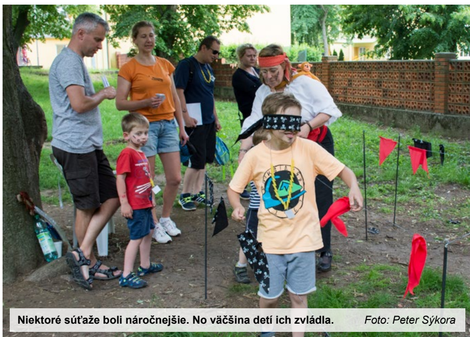
Niektoré súťažne boli náročnejšie. No väčšina detí ich zvládla.