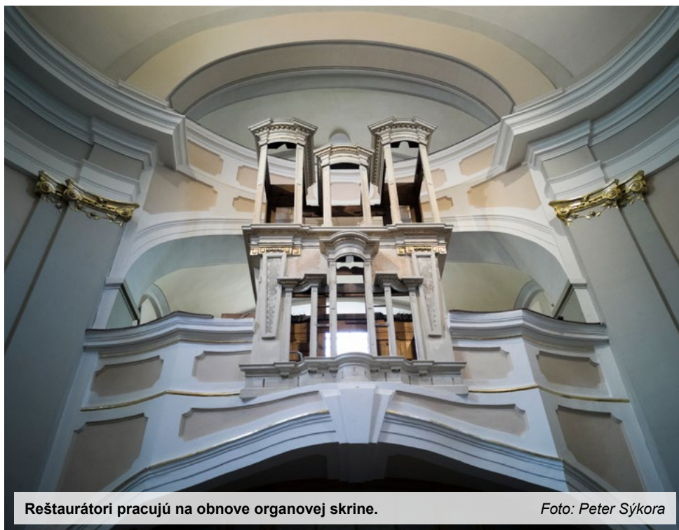
Reštaurátori pracujú na obnove organovej skrine.