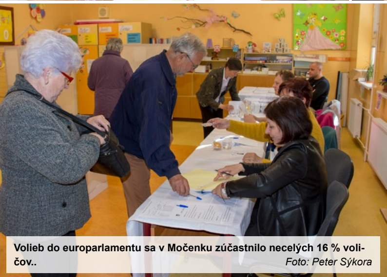
Volieb do europarlamentu sa v Močenku zúčastnilo necelých 16 % voličov..