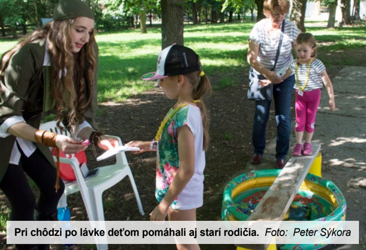
Pri chôdzi po lávke deťom pomáhali aj starí rodičia.