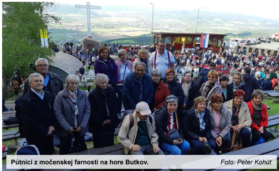
Pútnici z močenskej farnosti na hore Butkov.