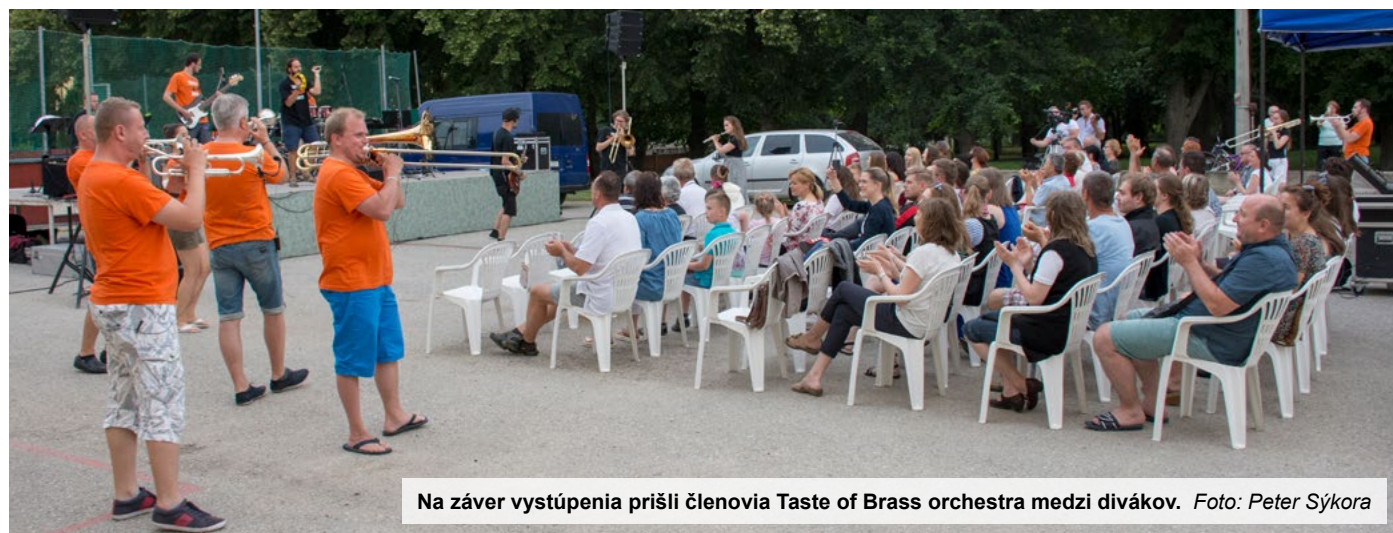
Na záver vystúpenia prišli členovia Taste of Brass orchestra medzi divákov.