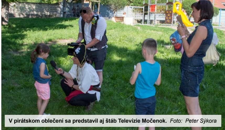
V pirátskom oblečení sa predstavil aj štáb Televízie Močenok.