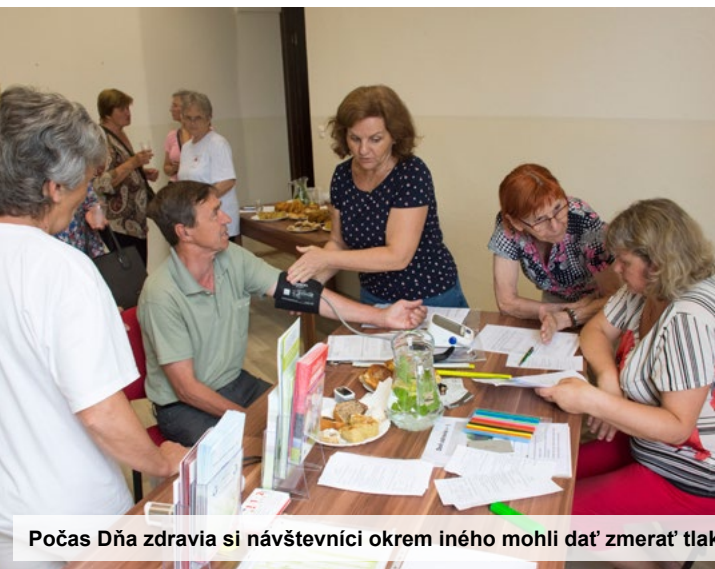
Počas Dňa zdravia si návštevníci okrem iného mohli dať zmerať tlak. Nechýbali ani rady, ako si majú pripraviť kváskový chlieb.