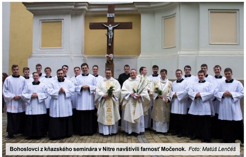
Bohoslovci z kňazského seminára v Nitre navštívili farnosť Močenok.