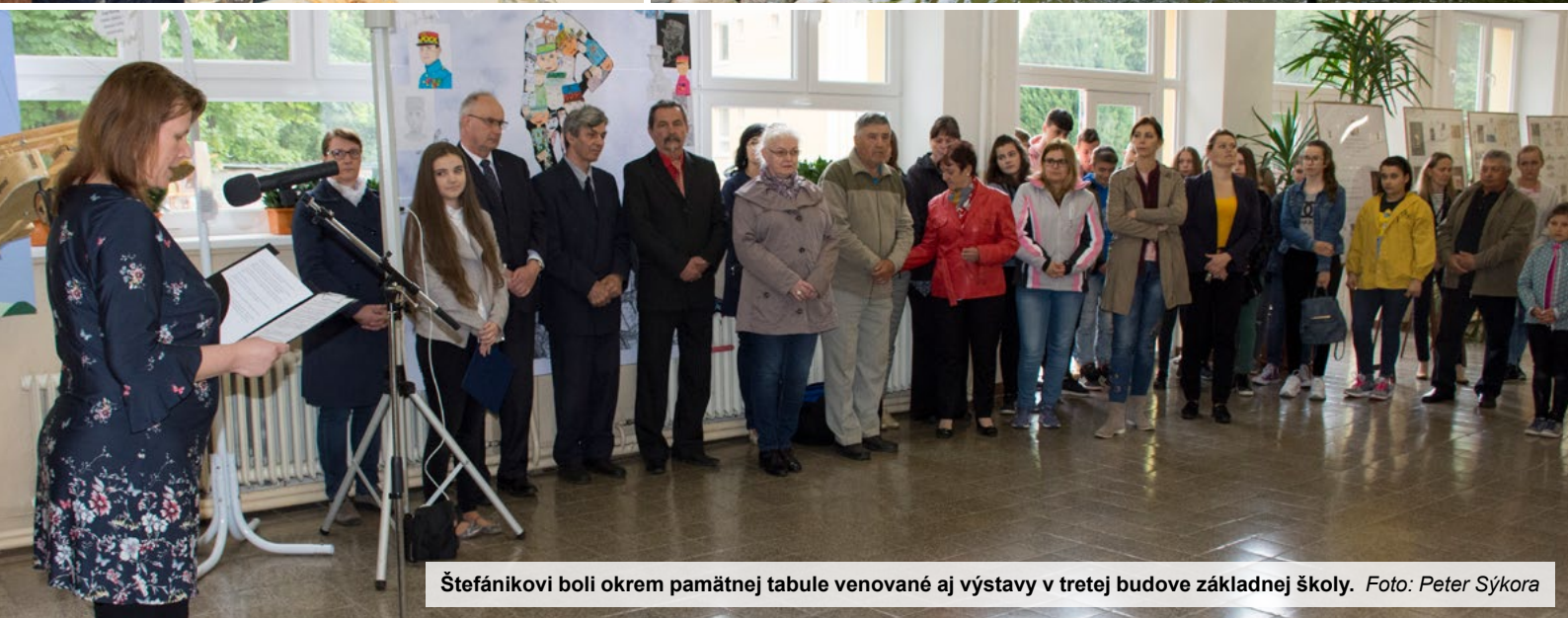
Štefánikovi boli okrem pamätnej tabule venované aj výstavy v tretej budove základnej školy.