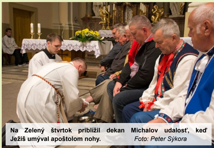
Na Zelený štvrtok priblížil dekan Michalov udalosť, keď Ježiš umýval apoštolom nohy.