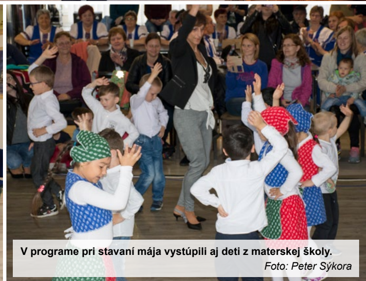
V programe pri stavaní mája vystúpili aj deti z materskej školy.