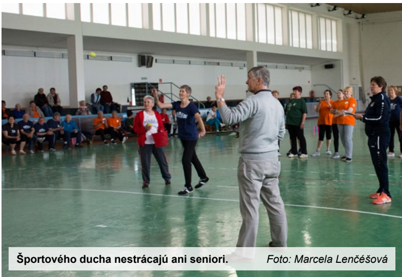
Športového ducha nestrácajú ani seniori.