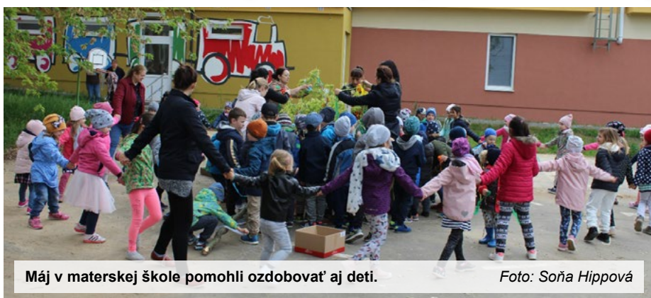
Máj v materskej škole pomohli ozdobovať aj deti.