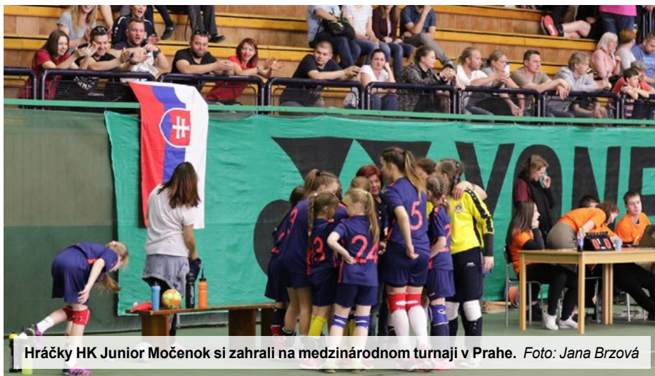
Hráčky HK Junior Močenok si zahrali na medzinárodnom turnaji v Prahe.