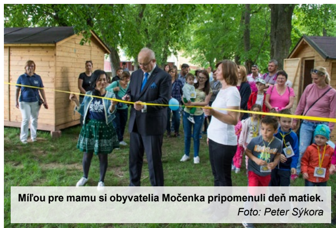
Míľou pre mamu si obyvatelia Močenka pripomenuli deň matiek.

študentka Katedry žurnalistiky FF UKF v Nitre