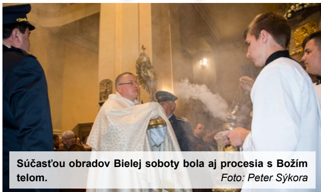
Súčasťou obradov Bielej soboty bola aj procesia s Božím telom.