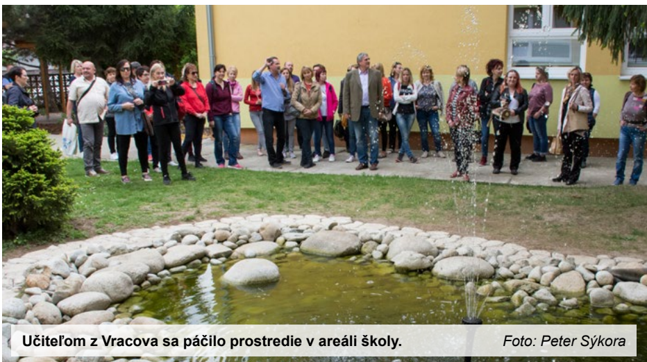
Učiteľom z Vracova sa páčilo prostredie v areáli školy.