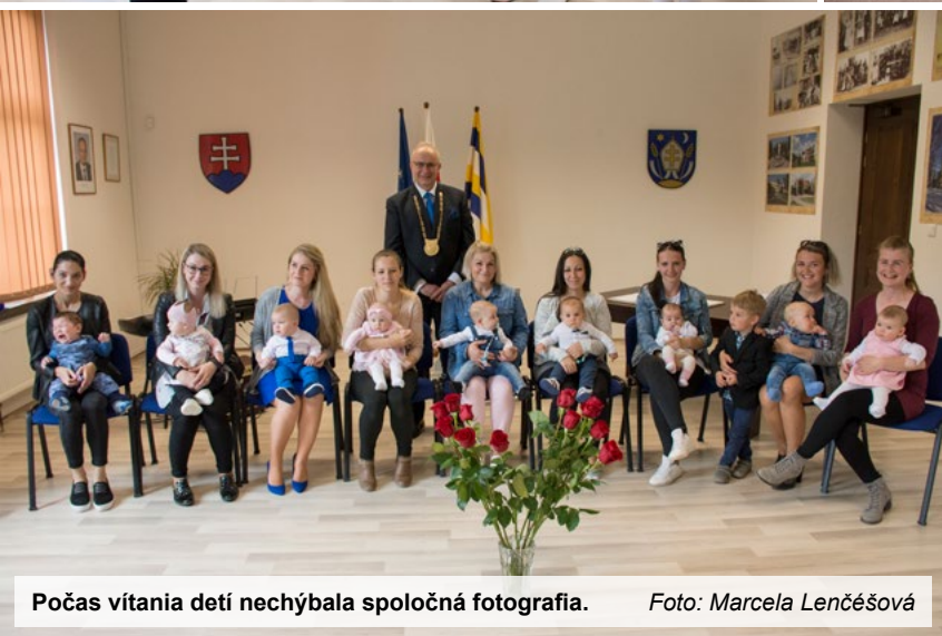
Počas víťania detí nechýbala spoločná fotografia.