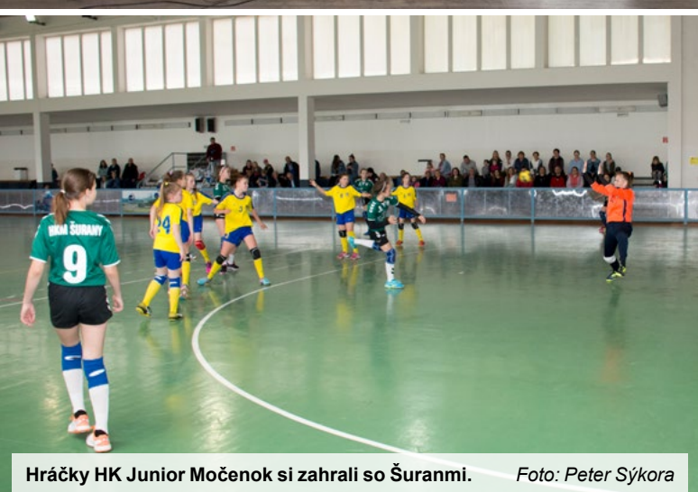
Hráčky HK Junior Močenok si zahrali so Šuranmi.