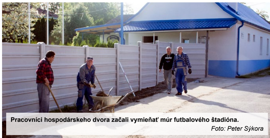
Pracovníci hospodárskeho dvora začali vymieňať múr futbalového štadióna.