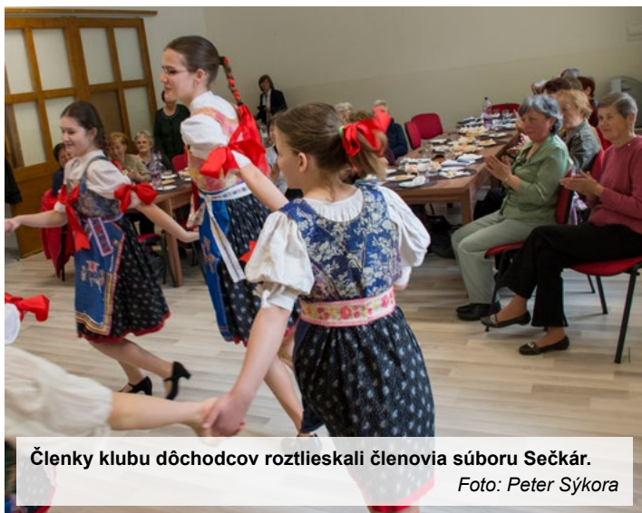
Členky klubu dôchodcov roztlieskali členovia súboru Sečkář.