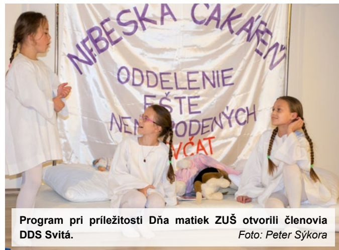
Program pri príležitosti Dňa matiek ZUŠ otvorili členovia DDS Svitá.