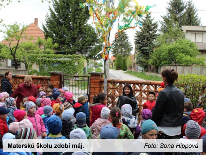
Materskú školu zdobí máj.