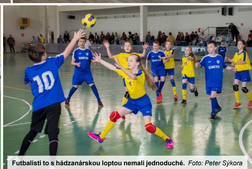
Futbalisti to s hádzanárskou loptou nemali jednoduché.