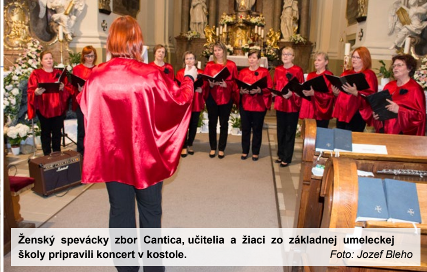
Ženský spevácky zbor Cantica, učiteľia a žiaci zo základnej umeleckej školy pripravili koncert v kostole.