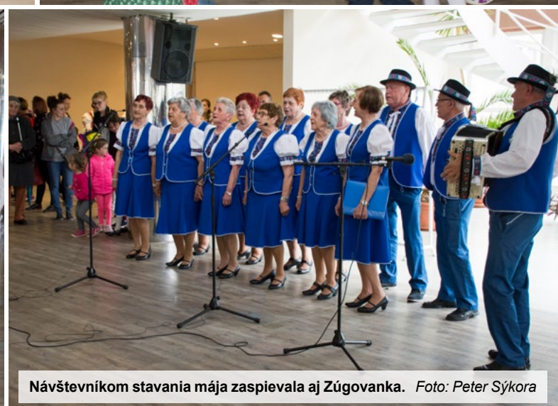
Návštevníkom stavaní mája zaspievala aj Zúgovanka.