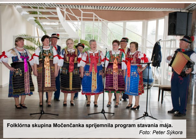
Folklórna skupina Močenčanka sprijemnila program stavaní mája.