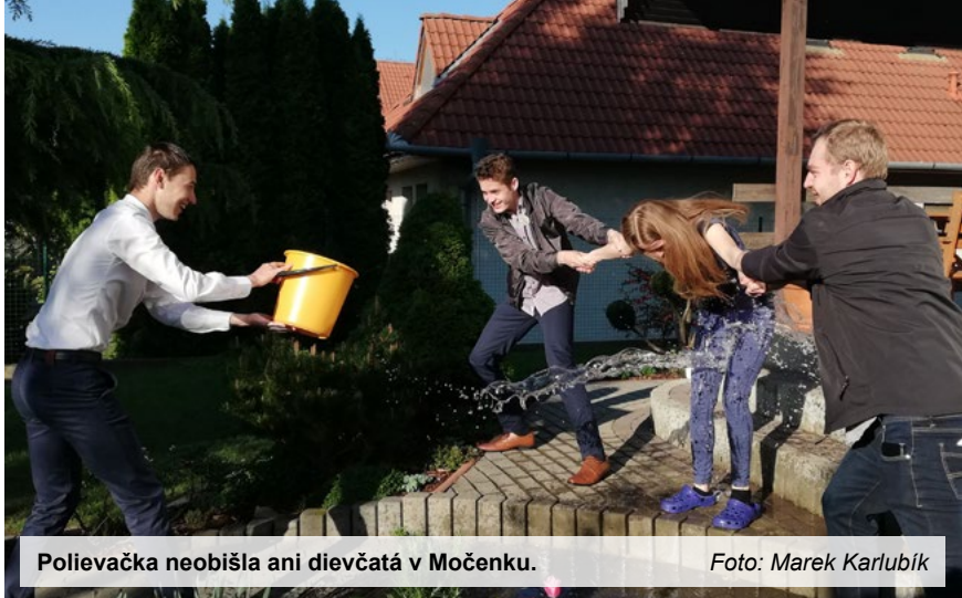
Polievačka neobišla ani dievčatá v Močenku.