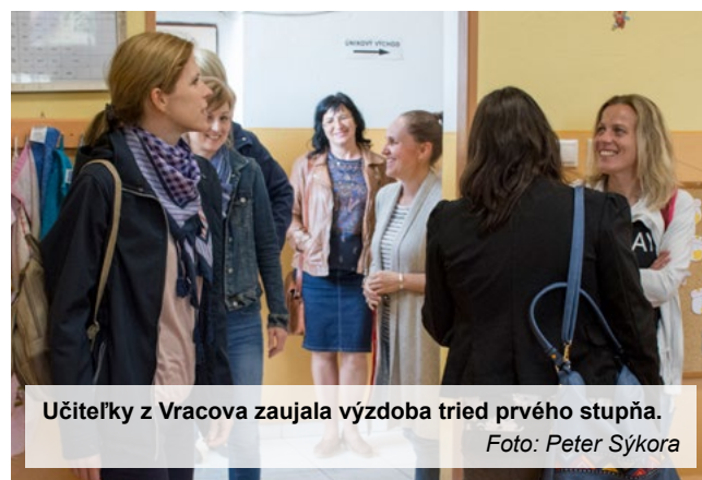
Učiteľky z Vracova zaujala výzdoba tried prvého stupňa.