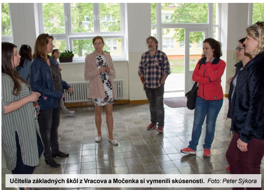
Učiteľia základných škôl z Vracova a Močenka si vymenili skúsenosti.