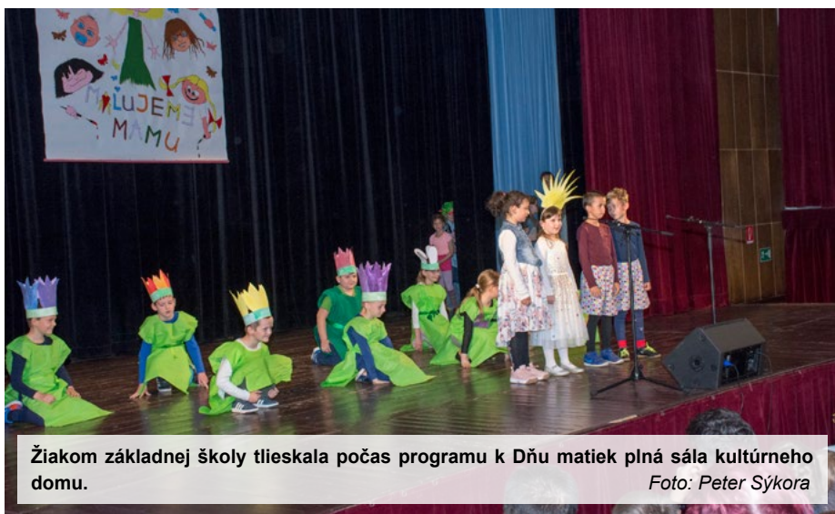
Žiakom základnej školy tleskala počas programu k Dňu matiek plná sála kultúrneho domu.