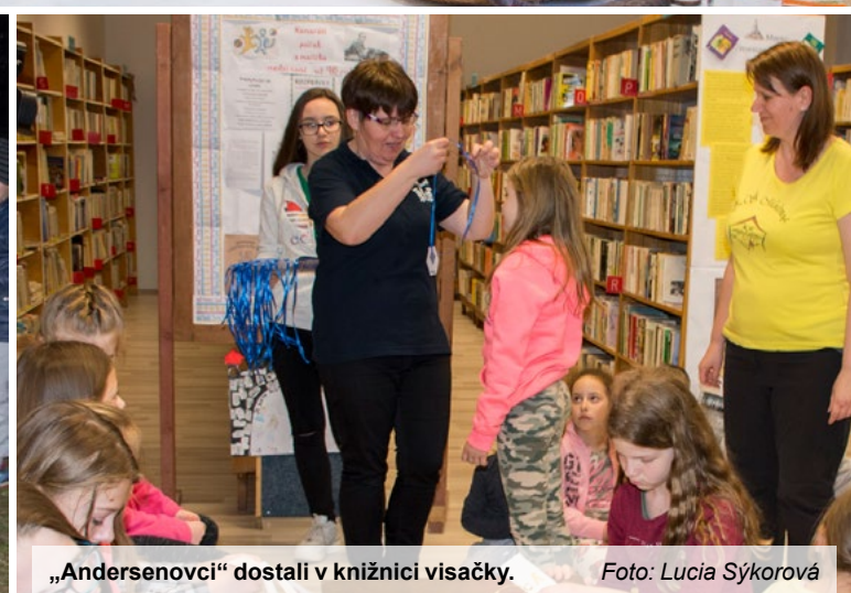
„Andersenovci“ dostali v knižnici visačky.