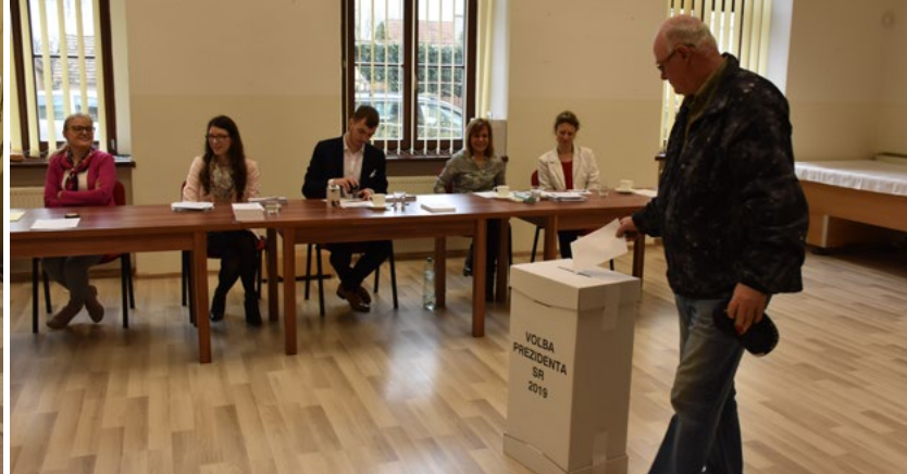
V druhom kole volieb bola účasť voličov nižšia.