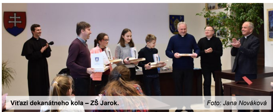
Vítazi dekanátneho kola – ZŠ Jarok.