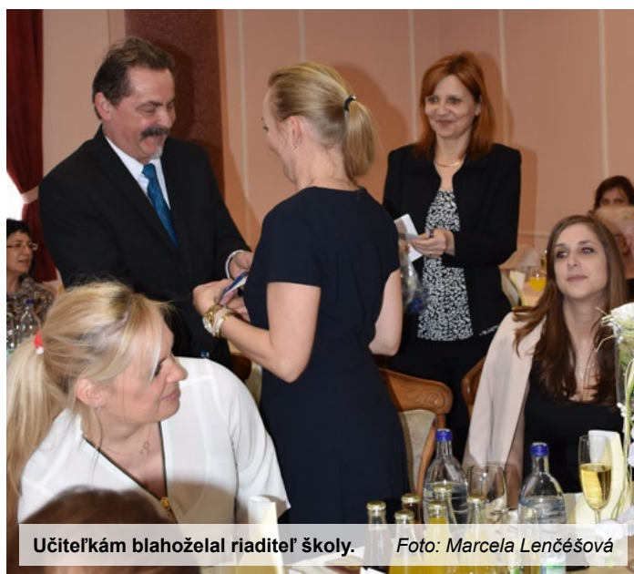
Učiteľkám blahoželal riaditeľ školy.