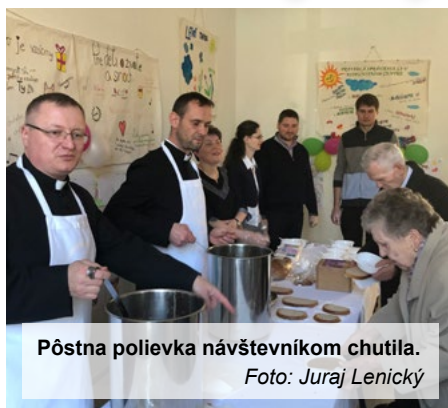
Pôstna polievka návštevníkom chutila.