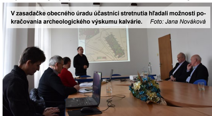
V zasadačke obecného úradu účastníci stretnutia hľadali možnosti pokračovania archeologického výskumu kalvárie.

V celoslovenskom meradle získala Zuzana Čaputová 1 056 582 hlasov, čo je 58,4 % hlasov všetkých voličov. Slovensko tak bude mať od 15. júna 2019 svojho 5. prezidenta voleného priamou voľbou, ale po prvý raz bude tento post zastávať žena. Marcela Lenčošová