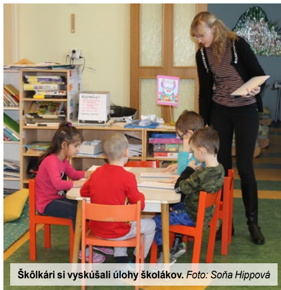
Škôlkári si vyskúšali úlohy školákov.