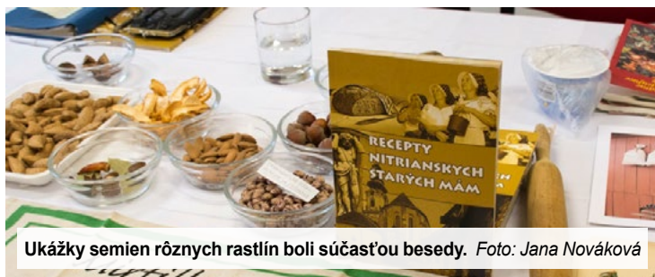
Ukážky semien rôznych rastlín boli súčasťou besedy.

Súčasťou besedy bola aj degustácia mrežkovníka od autorky knihy či nátierky z topeného syra, ktorú pripravili v rámci aktivít detí a klienti komunitného centra. Poďakovanie patrí pracovníčkam komunitného centra, ktoré pripravili na ochutnávku múčnikov slané syrové praclíky,