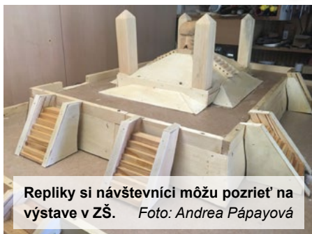
Repliky si návštevníci môžu pozrieť na výstave v ZŠ.

Dovolím vám nahliadnúť pomyselnou kľúčovou dierkou do priprav osláv 100. výročia úmrtia legendy slovenského národa Milana Rastislava Štefánika.