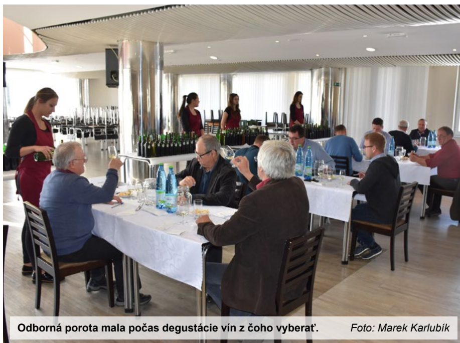
Odborná porota mala počas degustácie vín z čoho vybrať.