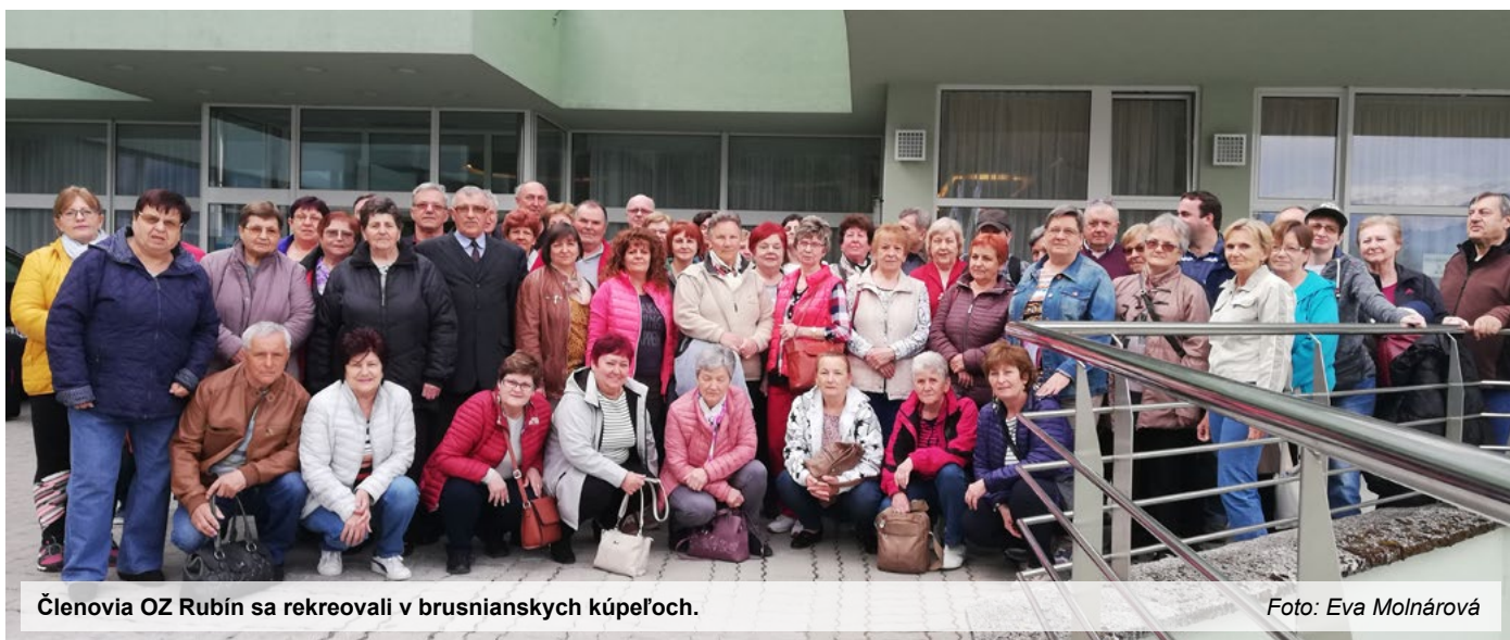
Členovia OZ Rubín sa rekreovali v brusnianských kúpeľoch.