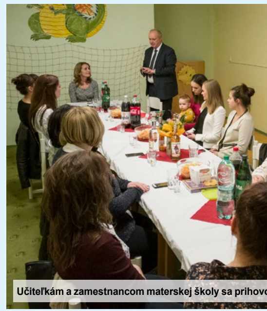
Učiteľkám a zamestnancom materskej školy sa prihovo

Dvadsiaty ôsmy marec – deň spätý s narodením Jana Amosa Komenského, je poctou jednému z najušľachtilejších povolání – povolaniu učiteľa. Často počujeme, že učiteľstvo je nielen povolaním, ale aj poslaním. S dantom pre učiteľské povolanie sa musí človek narodiť... Musí byť vybavený veľkou dávkou trpezlivosti, vytrvalosti, tvorivosti, empatie a iných vlastností.