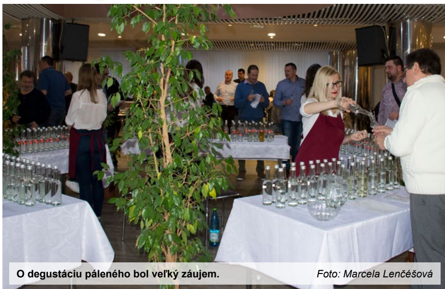
O degustáciu páleného bol veľký záujem.