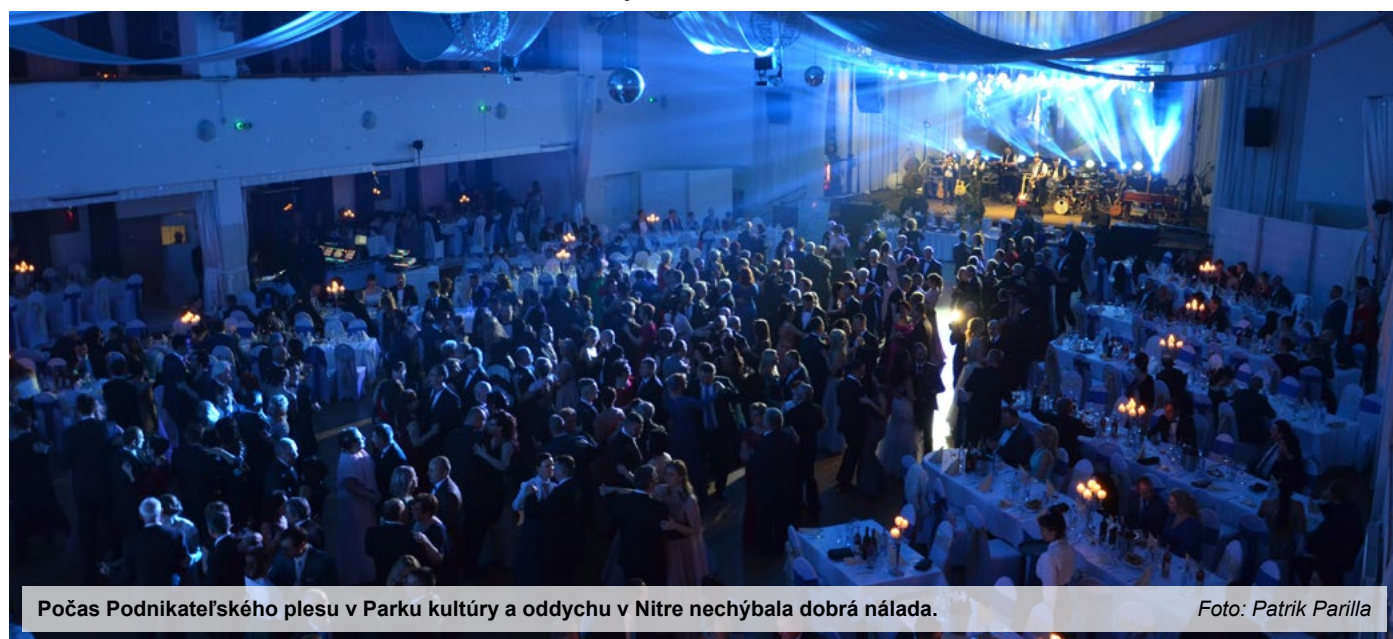
Počas Podnikateľského plesu v Parku kultúry a oddychu v Nitre nechýbala dobrá náladu.