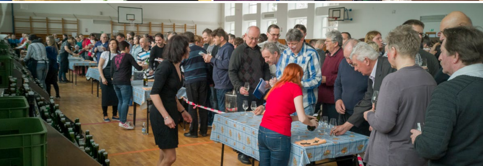
Na tradičnom Košte vín vo Vracove (ČR) sa zúčastnili aj vinári z Močenka a získali 6 zlatých medailí.