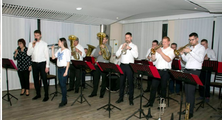
Dychová hudba Močenská kapela.