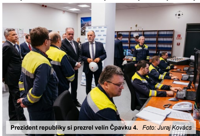
Prezident republiky si prezrel velín Čpavku 4.

Prezident republiky Andrej Kiska na túto skutočnosť reagoval: „Tak, ako máme v súčasnosti postavené školstvo, nebudeme môcť vychovávať odborníkov. Pre chemikov, ktorí sú tu tak potrební, sa pomaly žiadne triedy neotvárajú. Vo fabrike je veľko starší personál,