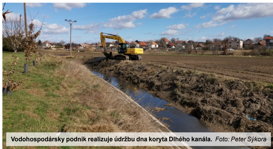
Vodohospodársky podnik realizuje údržbu dna koryta Dlhého kanála.