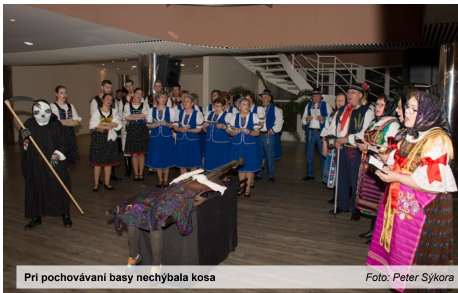
Pri pochovávaní basy nechýbala kosa