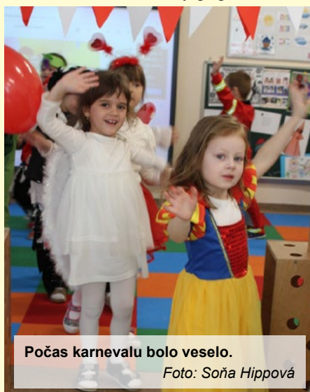
Počas karnevalu bolo veselo.

veselo šantia, tešia sa, že môžu byť v maskách, ktoré im maminky pripravili. Je tu