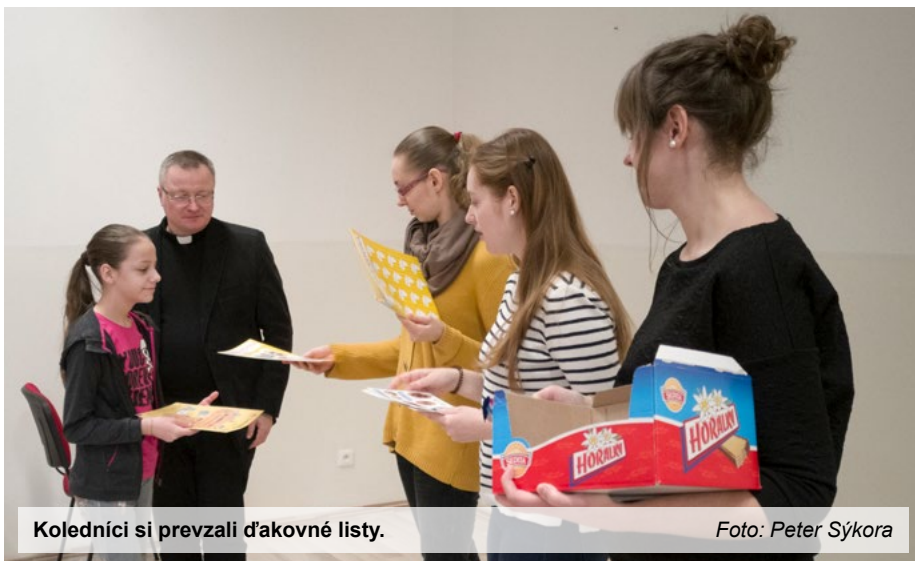
Koledníci si prevzali ďakovné listy.