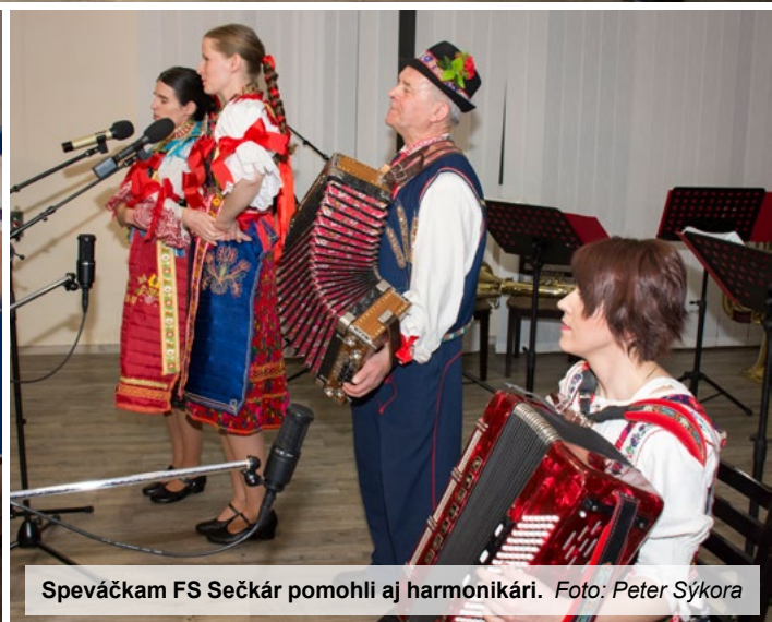
Speváčkam FS Sečkář pomohli aj harmonikári.