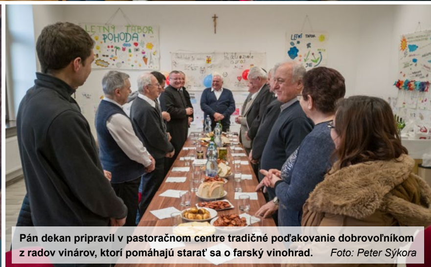
Pán dekan pripravil v pastoračnom centre tradičné poďakovanie dobrovoľníkom z radov vinárov, ktorí pomáhajú starať sa o farský vinohrad.