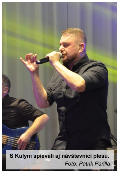
S Kulym spievali aj návštevníci plesu.