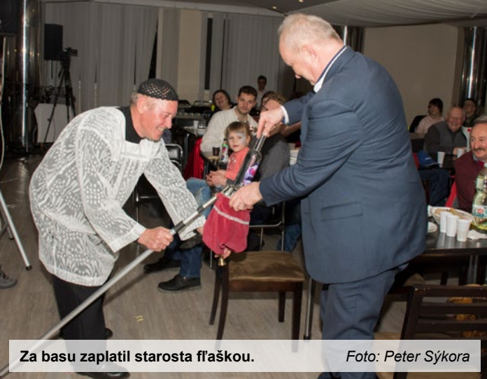
Za basu zaplatil starosta fľaškou.