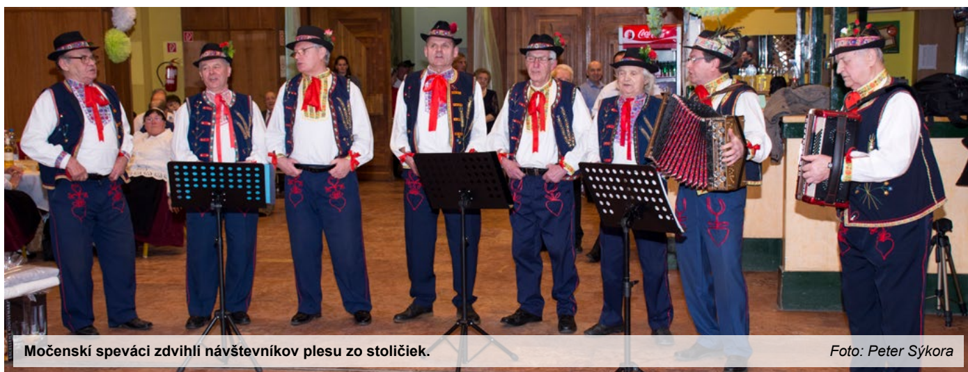
Močenský speváci zdvihli návštevníkov plesu zo stoličiek.