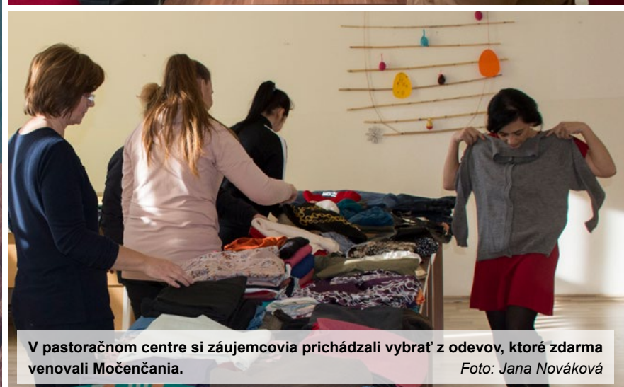
V pastoračnom centre si záujemcovia prichádzali vybrať z odevov, ktoré zdarma venovali Močenčania.