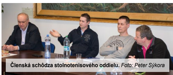
Členská schôdza stolnotenisového oddielu.

Pre mňa je predsedníctvo výzva nielen dosahovať osobné úspechy ako doposiaľ, ale aj dosiahnuť úspechy ako tím, komunita krásneho športu, akým je stolný tenis. Chcem, aby sme fungovali, aby sa tešili všetci na zápasy či tréningy, aby sme sa tešili na stretnutia, kde dokážeme vypnúť z každodenných povinností. Stolnému tenisu zdar. Martin Gálik