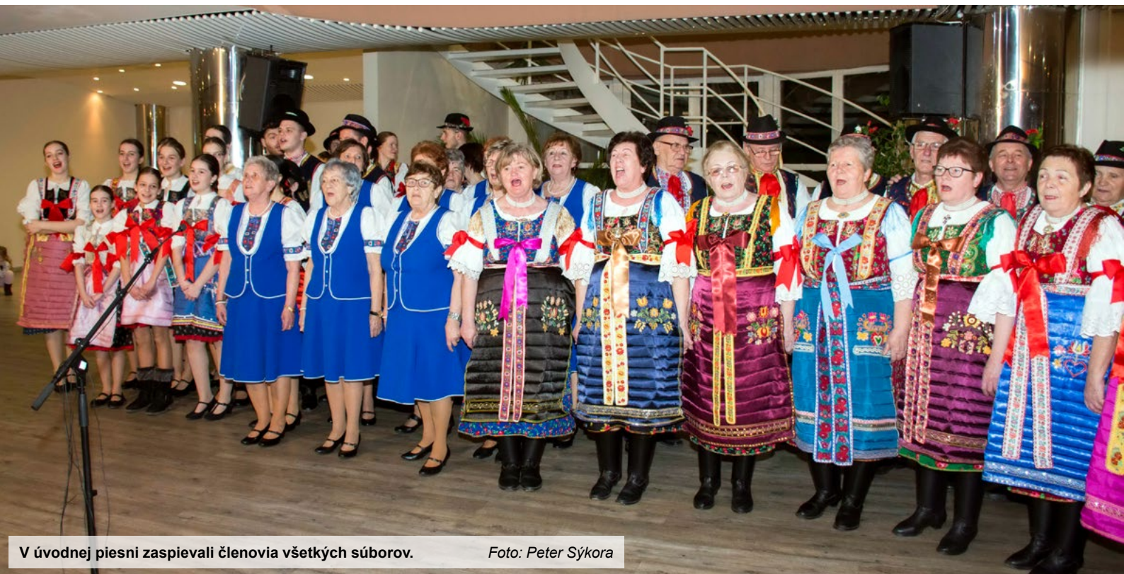
V úvodnej piesni zaspievali členovia všetkých súborov.