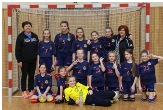
Hádzanáčky HK Junior Močenok vyhrali medzinárodný turnaj.