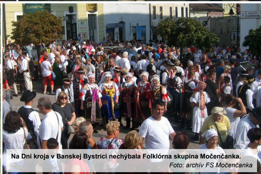
Na Dni kroja v Banskej Bystrici nechýbala Folklórna skupina Močenčanka.