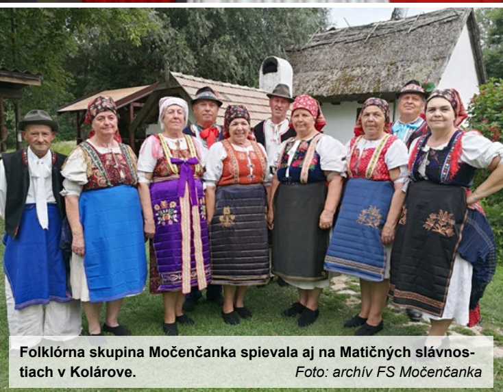
Folklórna skupina Močenčanka spievala aj na Matičných slávnostiach v Kolárovo.