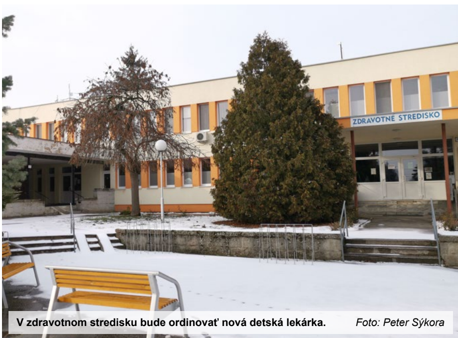
V zdravotnom stredisku bude ordinovať nová detská lekárka.