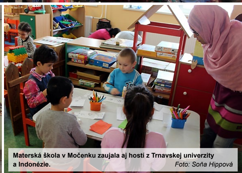
Materská škola v Močenku zaujala aj hostí z Trnavskej univerzity a Indonézie.