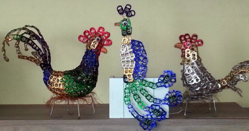
Členovia Klubu tvorivosti dokážu vytvoriť umenie aj z vrchnáčikov, ktoré zvyčajne končia v odpade.