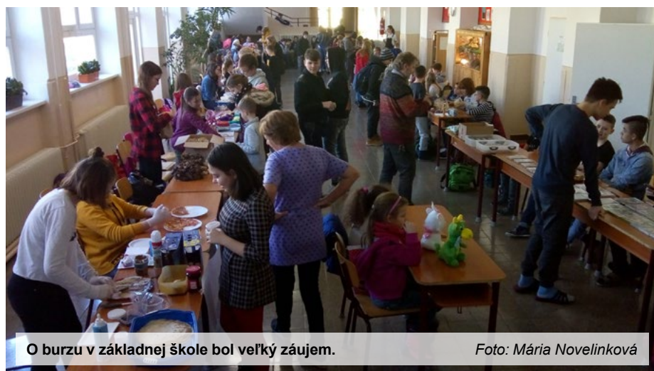
O burzu v základnej škole bol veľký záujem.