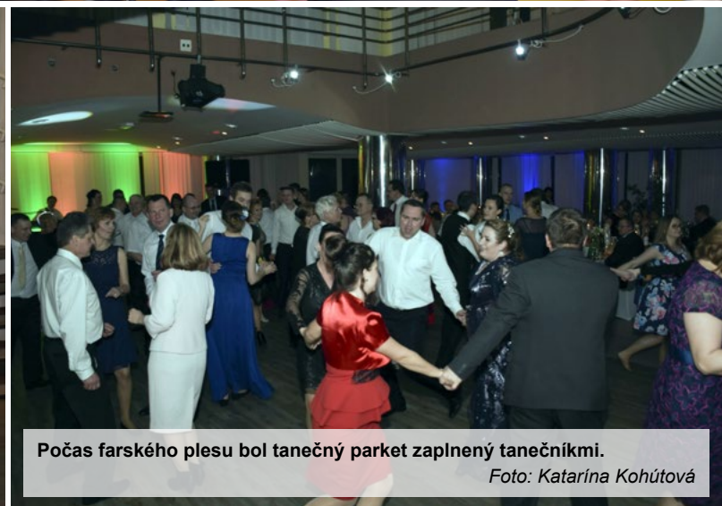
Počas farského plesu bol tanečný parket zaplnený tanečníkmi.