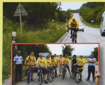
Po stopách Gorazda