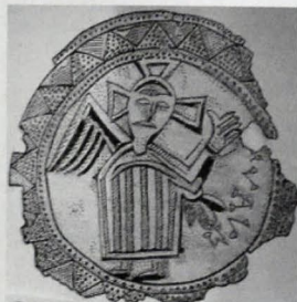
Úlomky z medených plaket s náboženským motívom

Vľavo - fotografia zvyškov, Vpravo - rekonštrukčný náčrt