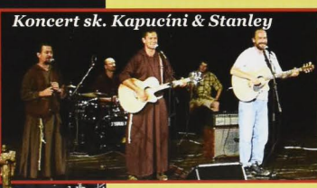
Koncert sk. Kapucíni & Stanley