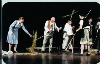
DS T. Vansovej Rimavská Píla