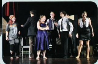
Divadlo Christoffer Bratislava