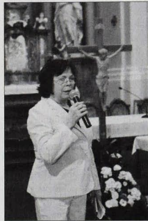
Program tretieho festivalového dňa