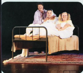
Divadlo Dominus Močenok