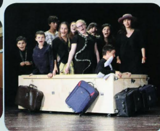
DS Bosniačik Teplička nad Váhom