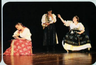
TEATRO COLORATO Bratislava