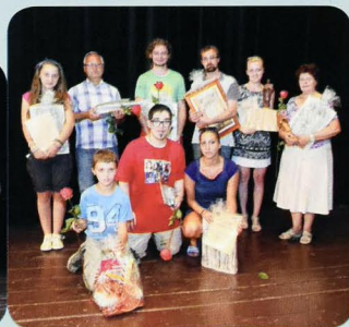
Ocenení účastníci Gorazdovho Močenku