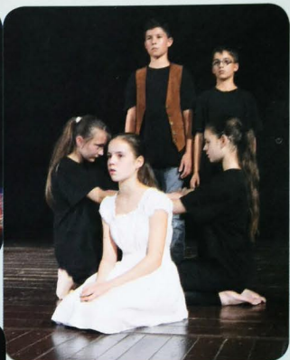
Detský recitačný kolektív KALORIK pri ZUŠ Bánovce nad Bebravou