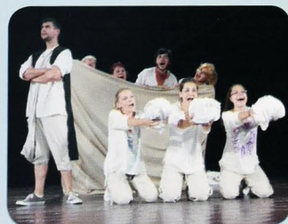
DS Materinky Šaľa