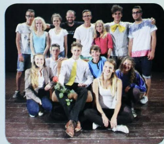
DS Saleziáni a Domka PC Partizánske-Štipok