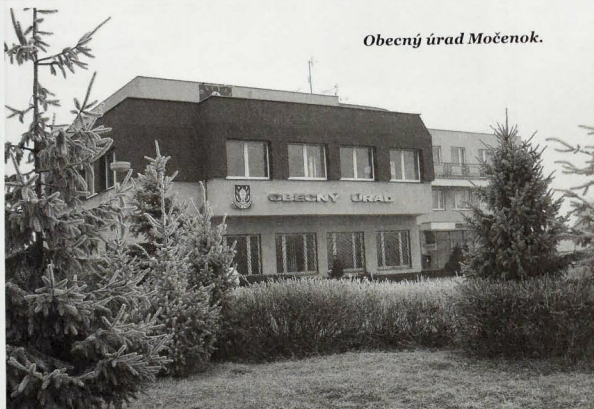
Obecný úrad Močenok.