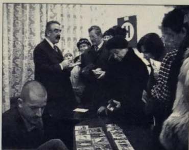
Robo Kazik - autogramiáda

Slávnosťný deň pokračoval galaprogramom v kultúrnom dome, v ktorom vystúpil populárny spevák Robo Kazik a ľudový rozprávač