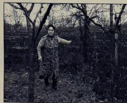
Pohľad do záhrad novej cesty

Jednou z významných investičných akcií, ktoré obec plánuje realizovať v blízkej budúcnosti, je výstavba miestnej komunikácie v lokalite Balajka.