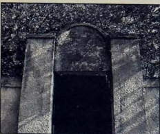
vstupná brána židovského cintorína