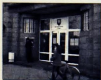
Obvodný úrad v Šali

Vymenili ste si už staré značky na nových aute? Koniec kalendárneho roka je už veľmi blízko a spolu s ním sa blíži aj skončenie platnosti štátnych poznávacích značiek vydaných do 1. apríla 1997. Ide o tzv. staré značky typu GA alebo NR so štyrmi číslicami. Majitelia takýchto áut by si mali vo vlastnom záujme do konca roka vymeniť tieto značky za