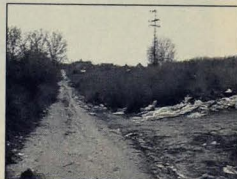
skládka na Vlkovej doline