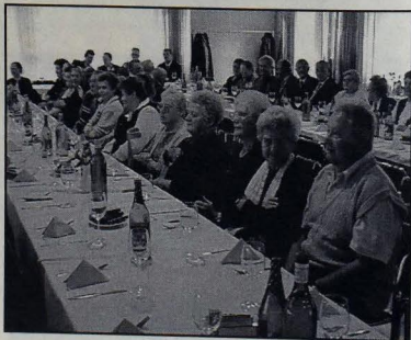
Pohľad na jubilantov v spol. sále OcÚ