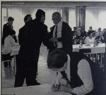
Odvzdávanie darčiekov a zápis do pamätnej knihy