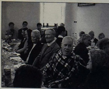
Z osláv obyvateľov domova dôchodcov.