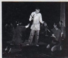
Detský divadelný súbor Čhave kamoro