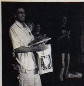
Tanečné divadlo ATak