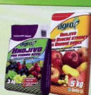
Hnojivo vinič 4,19€ ovocné stromy 6,59€