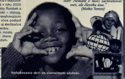
koledovanie detí vo vianočnom období