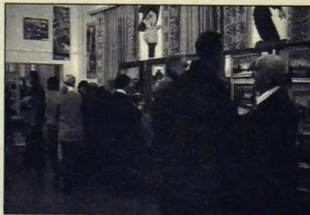
záber z výstavy močenenských maliarov

Podľa slov mnohých účastníkov osláv to bola veľmi vydarená kultúrna akcia, mimoriadne si pozvanie cenili rodáci, ktorí tak mali možnosť stretnúť sa s rodákmi, zaspomínať na staré časy a vidieť ako Močenok napreduje v oblasti kultúry i ekonomiky. Oceneniami, ktoré dostali, boli príjemne prekvapení a potešení aj naši ocenení spolubčania. Vážme si takýchto ľudí a snažme sa, aby ich bolo v Močenku čo najviac.