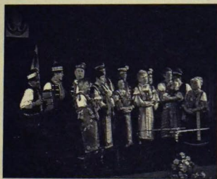
Výstupenie FS Močenanka

Koncom novembra mali všetci obyvatelia Močenku, rodáci i priatelia našej obce možnosť zúčastniť sa osláv 890. výročia prvej písomnej zmienky o Močenku a zároveň hodových osláv na sviatok sv. Klementa – patróna nášho kostola, ktorý nesie jeho meno.