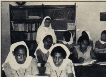
■ Sestra Bohdana pri vyučovaní

Tento návrat do vlasti sa jej podaril v roku 1968. Pri svojich spolusestrách zostala necelý rok. Po druhý raz opustila svoj rodný kraj 10. augusta 1969, aby pokračovala vo svojej misionárskej činnosti na N. Guinei až do roku 1977. Účinkovala tu 28 rokov. Potom sa vrátila do provinciálneho domu v Austrálii na zaslúžený odpočinok. Ale aj tu sa venovala podľa svojich síl slovenským a maďarským emigrantom. Od