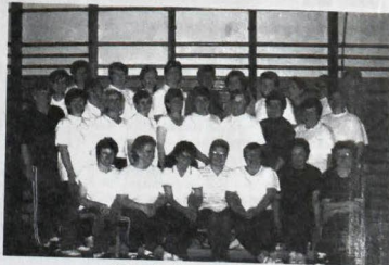
Fotografia niektorých cvičienek