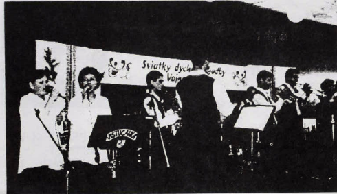
Členovia DH Močenčanka počas vystúpenia vo Vajnoroch