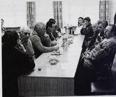
Stretnutie neprofesionálnych výtvarníkov v KS Močenok