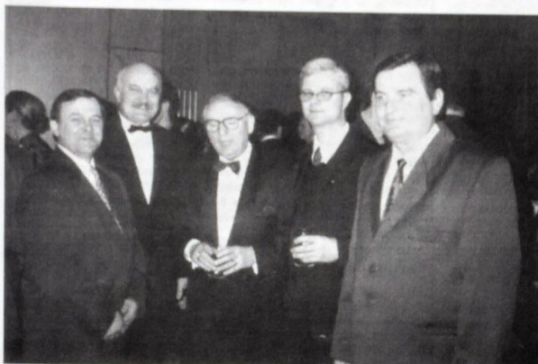
Üčastníci slávnostnej recepcie konanej na pôde Veľvyslanectva SR v Paríži z príležitosti "Dni Nitrianskeho kraja vo Francúzku"