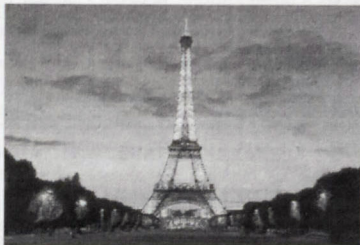
Dominantou Paríža je Eiffelova veža. Asi od r. 1889 sa pod ňou rozprestiera Champs de Mars. Najväčší vojenský akol, neskôr prebudovaný na záhradu. V súčasnosti je táto rozsiahla plocha zelené sídlom mnohých svetových výstav.

Obecné zastupiteľstvo na svojom októbrom zasadnutí schválilo pracovnú cestu starostu obce do Paríža. V dňoch od 14. januára do 19. januára 2001 sa táto zahraničná služobná cesta uskutočnila. Organizátorom tejto akcie bol Krajský úrad Nitra - odbor regionálneho rozvoja a iných odvetvových vzťahov a Veľvyslanectvo SR v Paríži. Cieľom prezentácie bola propagácia Nitrianskeho kraja na veľkom a solventnom trhu, akým je Francúzsko bezpochyby je. Prezentácia Nitrianskeho kraja a teda i Močenku trvala tri dni, pričom každý deň bol venovaný inej téme. Každý deň sa uskutočnili bilaterálne obchodné rokovania medzi zúčastnenými inštitúciami, ako i štátna recepcia SR s prezentáciou jednotlivých firiem, okresov, miest a obcí. Na pôde veľvyslanectva SR v Paríži bola k dispozícii osobitná sála. V sále návštevných boli v priestoroch sály inštalované jednotlivé oblasti regiónu Nitrianskeho kraja. Naša obec bola zastúpená samostatným panelom, kde boli obrazy historických a významných budov z našej obce. Bol to objekt kaplnky Sv. Gorazda, Charitný domov atď. Súčasťou prezentácie našej obce bol i Penzión ANUP.