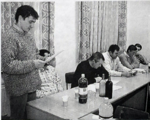
Schôdza FK Poľnohospodár Močenok