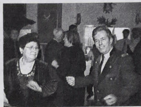
Poľovnícky ples v reštaurácii Elsa