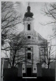
Kostol sv. Klimenta v Močenku