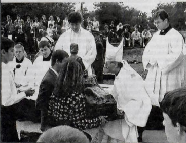
Sv. omša v Gorazdove