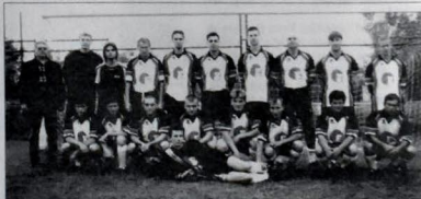
Športový klub ŠK Močenok