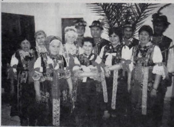
Folklórna skupina Močenečka