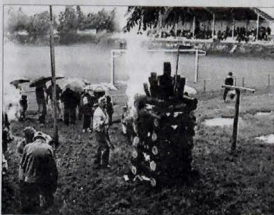
Vatra zvrchovanosti na futbalovom štadióne