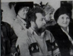
Rozpráva o novej ulici v Tango

dôstojných pozemkov - každý akčívnotou čiastkou - prispeli na pozemok, ktorý bude potrebné odkúpiť pre prístup k novovytvorenej ceste zo strany ulice Ľudovíta Štúra. Obec súčasne vstupuje do rokovania s vlastníkom pozemku na Štúrovej ulici. Tento pozemok bude slúžiť ako prístupová komunikácia na novú cestu. Na stretnutí však nechýbali ani protichodné názory. Väčšina časť prítomných občanov súhlasila s návrhom. Jedným z hlavných dôvodov obyvateľov ulíc Nitrianskej a Vlnohradskej na vybudovanie novej ulice je poskytnutie stavebných pozemkov mladým ľuďom. Na týchto uliciach je mnoho starších ľudí, ktorí nevládzu obrábať túto pôdu a preto súhlasia s utvorením stavebných pozemkov. Obyvatelia, ktorí nie sú za takýto návrh, nesúhlasia s vyplatením akčívnotou čiastky na odkúpenie pozemku, ktorý by slúžil ako prístupová komunikácia z ulice Ľudovíta Štúra na novú ulicu. Taktiež žiadajú vyplatenie zobrať pýty na cestnú komunikáciu za úradnú cenu. V závere bol dohodnutý postup pre ďalšie rokovania.