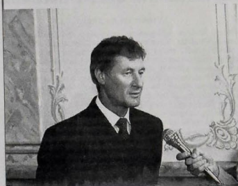
Pavol Hrušovský, podpredseda NR SR

- V čom by bolo potrebné posilniť právomoci obce? Prípravovaná reforma verejnej správy prináša veľmi zásadnú zmenu aj pokiaľ sa týka samotných kompetencií, ktoré vykonávajú obce podľa teraz platnej legislatívy. Je to treba posilniť autoritou, kompetenciou a právnou subjektivitou obcí v čo najväčšom rozsahu. Ukazuje sa, že obce sú ďaleko lepším hospodárom s majetkom, s peniazmi a so všetkým čo patrí do ich vlastnictva ako štát. Preto sa nazdávam, že je treba posilniť právomoci obce zo strany sociálnej