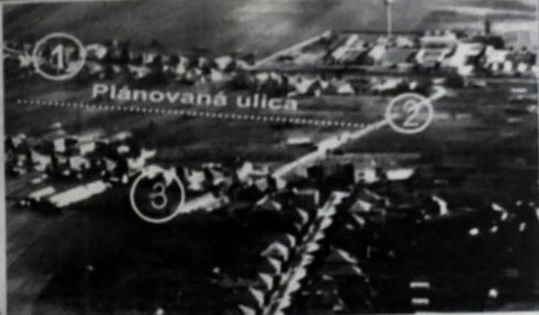
1 - Nitrianska ulica 2 - ul. E. Štura 3 - Vlnohradská ul.