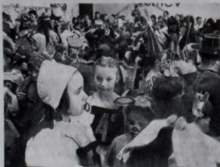
Karneval v CVC

Opäť je tu ľahkovôň obdobie. Čas pieslov, zábav, karnevalov. Obdobie, keď sa môžeme raz do roka zabaviť a vyfantíť v maske, v ktorej nás možno nikto nespozná. Prvý karneval sa uskutočnil v materskej škole v posledný deň pred jarnými prázdninami. Už trojroční deti sa nesporne s veľkou radosťou tešili na "prezlečenie sa" do inej kože, do inej bytosti, či veci.