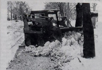
Odpratávanie snehu v obci zabezpečovali pracovníci hospodárskeho dvora