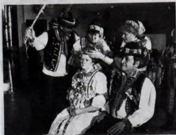
Svadobný obrod v mládeži