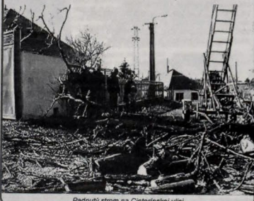
Padnutý strom na Cintorínskej ulici