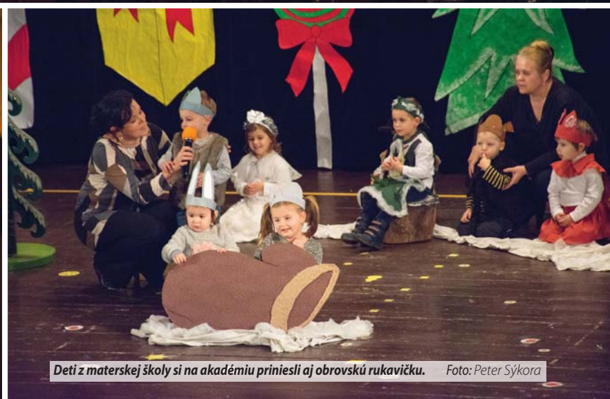
Deti z materskej školy si na akadémiu priniesli aj obrovskú rukavičku.