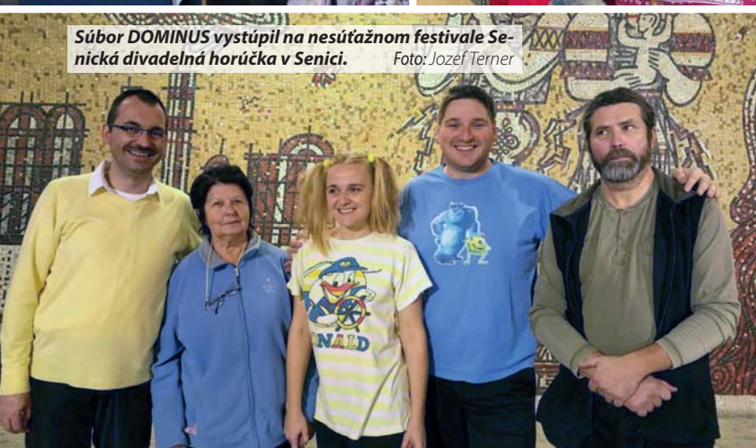
Súbor DOMINUS vystúpil na nesúťažnom festivale Senická divadelná horúčka v Senici.