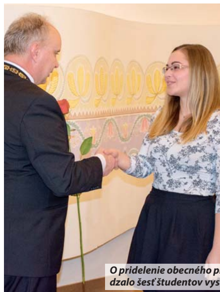
O pridelenie obecného prospechového štipendia sa uchádzalo šesť študentov vysokých škôl.