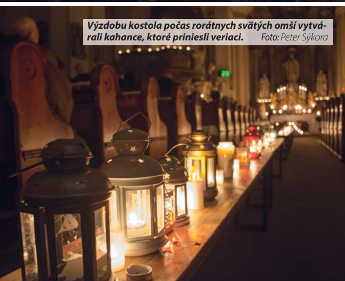
Výzdobu kostola počas rorátnych svätých omši vytvárali kahance, ktoré priniesli veriaci.