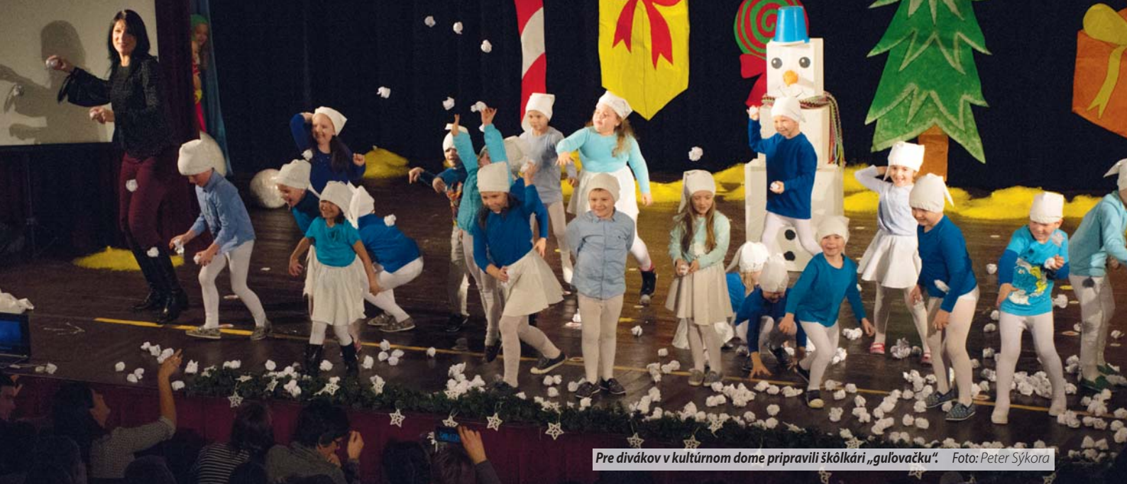
Pre divákov v kultúrnom dome pripravili škôlkári „guľovačku“.