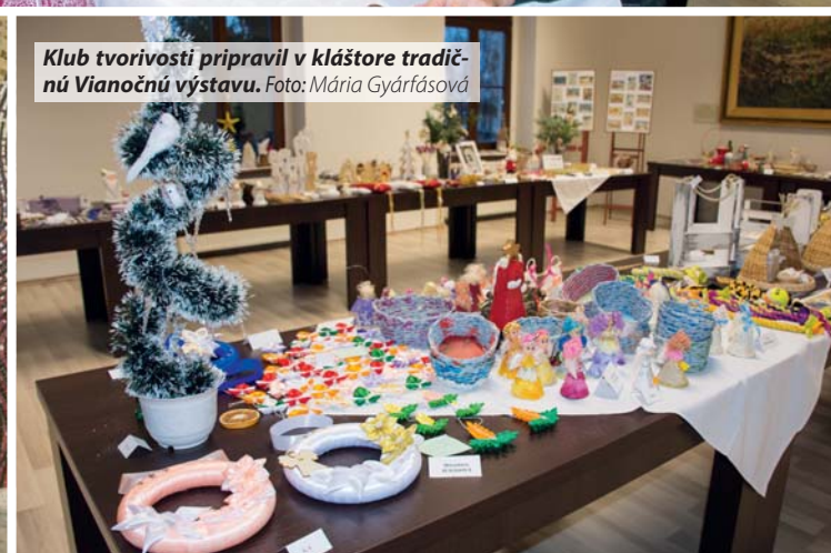
Klub tvorivosti pripravil v kláštore tradičnú Vianočnú výstavu.