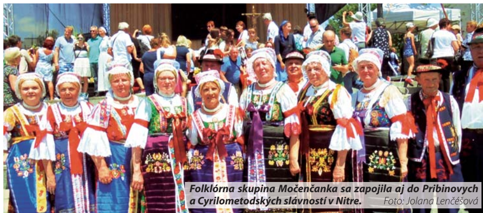
Folklorná skupina Močenčanka sa zapojila aj do Pribinových a Cyrilometodských slávností v Nitre.

Skupina Močenčanka v decembri naspievala tiež časť piesní na CD Močenenské Vianoce. Peter Sýkora