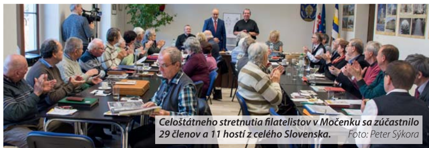
Celoštátneho stretnutia filatelistov v Močenku sa zúčastnilo 29 členov a 11 hostí z celého Slovenska.