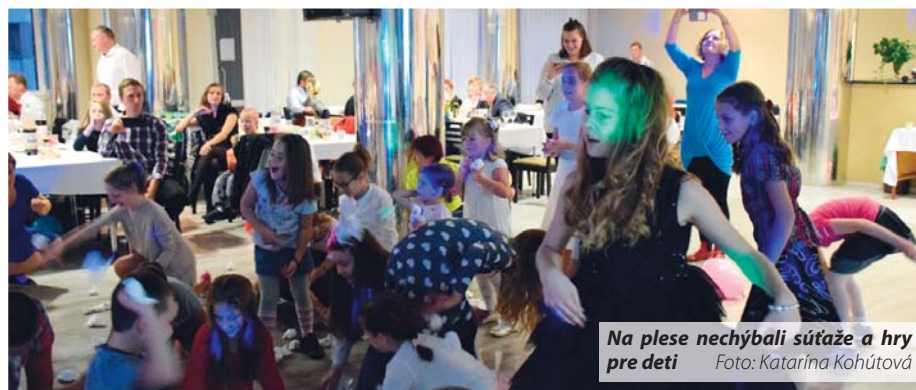
Na plese nechýbali súťaže a hry pre deti