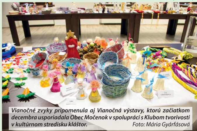
Vianočné zvyky pripomenula aj Vianočná výstava, ktorú začiatkom decembra usporiadala Obec Močenok v spolupráci s Klubom tvorivosti v kultúrnom stredisku kláštor.

Budeme vám vďační, ak svojimi spomienkami na históriu obce pomôžete autorom monografie aj vy. Svoje podnety môžete poslať na monografia@mocenok.sk alebo priniesť do klient-