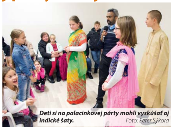
Deti si na palacinkovej párty mohli vyskúšať aj indické šaty.

Močenok 3 dni. Počas sv. omši sa venoval témam Kríž a utrpenie a Jeho misia je moja misia. V nedeľu popoludní sa stretol s veriacimi v pastoračnom centre. Diskutoval s nimi napríklad o okultizme a joge.