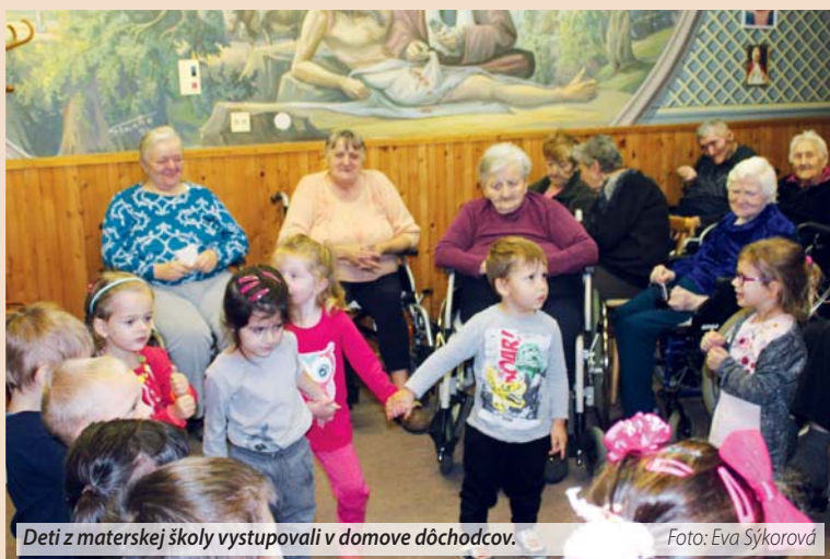
Deti z materskej školy vystupovali v domove dôchodcov.

V rámci všetkých tried materskej školy sme sa celý týždeň venovali téme: jeseň života – naši starkí. Rôznymi aktivitami sme sa snažili budovať úctu k starším. Deti vyjadrovali svoju lásku k starkým krásnymi kresbami i malbami. Učili sa rôzne básničky a pesničky, dramatizovali rozprávku Ako dedko ťahal repku. Rozprávali o tom, čo so starými rodičmi najradšej robia. Vyrábali a odberali svojich starkých rôznymi dar-