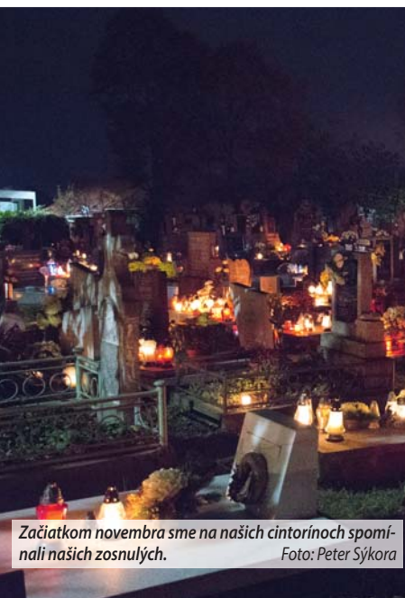
Začiatkom novembra sme na našich cintorínoch spomínali našich zosnulých.