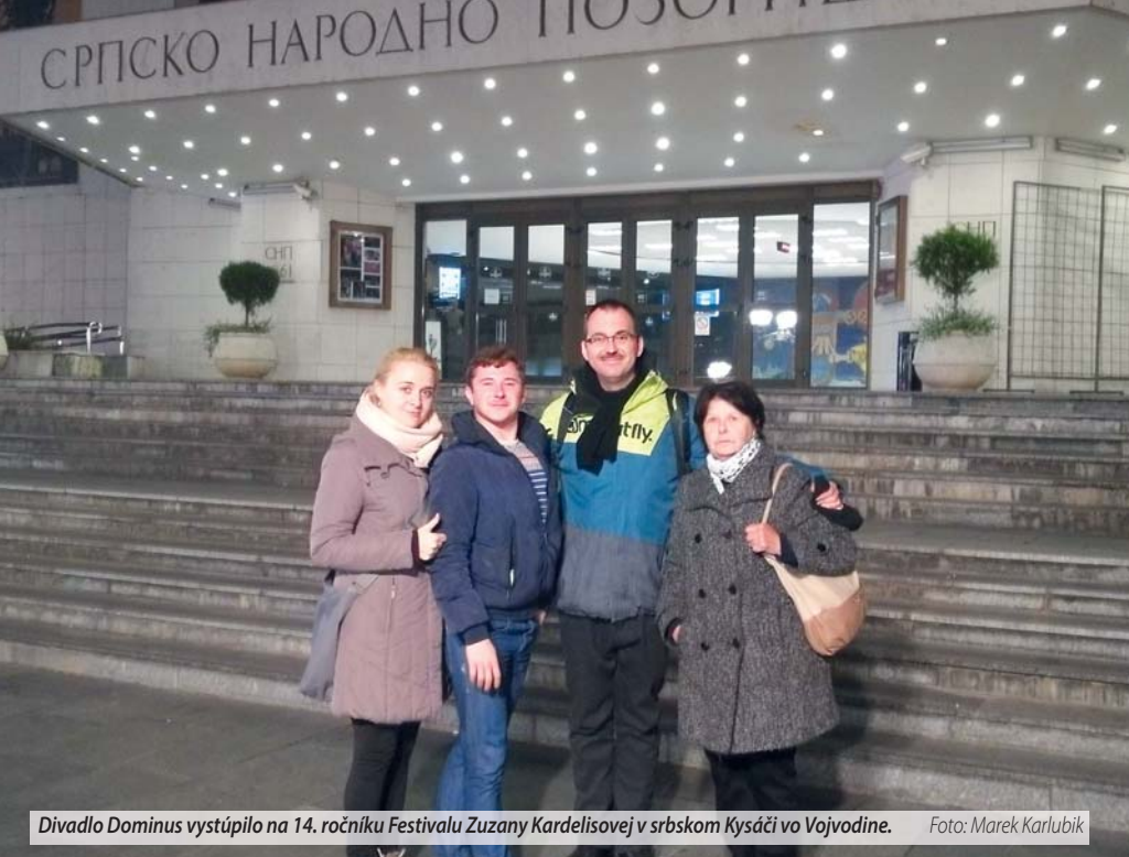
Divadlo Dominus vystúpilo na 14. ročníku Festivalu Zuzany Kardelisovej v srbskom Kysáči vo Vojvodine.