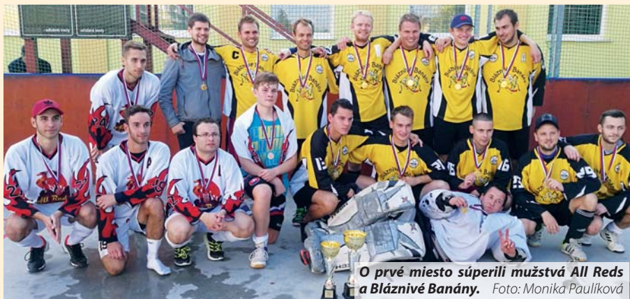
O prvé miesto súperili mužstvá All Reds a Bláznivé Banány.