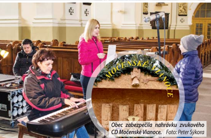
Obec zabezpečila nahrávku zvukového CD Močenské Vianoce.