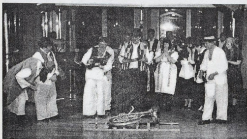
Členovia divadelného súboru trúchliaci nad pochovanou basou.