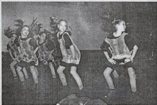
Trendáčatá Detva - najúspešnejší detský tanečný súbor na DG '98.