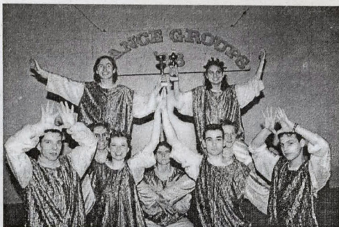
Tanečná skupina JUMP! Močenok po finále DG '98.