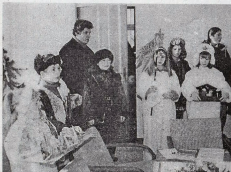
Počas Vianoc zavítali do mnohých domácností koledníci s "dobrou novinou". V sprievode pána farára neobišli ani obecný úrad.