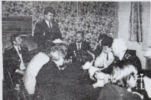
Rokovanie požiarnikov sa nieslo v priateľskej a tvorivej atmosfére...