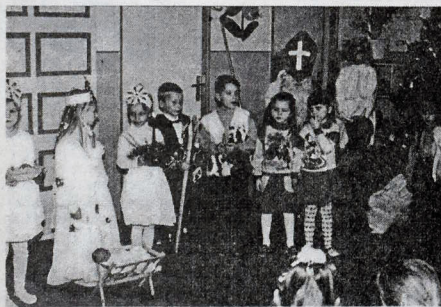
Sv. Mikulášovi sa deti poďakovali za darčeky pekným a milým programom.