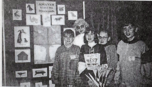
Časť našej expozície v Bratislave.