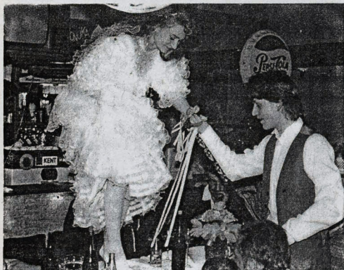
K vrcholom svadobnej hostiny patri odvádzanie nevesty od stola a nasievanie čepčenie.

Život každej rodiny z času na čas rozvíja tá slávnostná udalosť, ktorou je svadba niekoho blízkeho. Každý svadobný rodič, mladomanžel či príbuzní, ktorí sú zainteresovaný na príprav a obdávne snažia aby tá ich svadba dopadla čo najlepšie. A k tomu, aby svadba prebehla tak ako má, neodmysliteľne patria svadobné zvyky a s nimi osoba starejšieho.