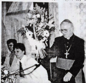
Medzi najvýznamnejších hostí festivalu patrili J.Em. Ján Chryzostom kardinál Korec.

postavenia medzi nami „tých iných“, aby sme