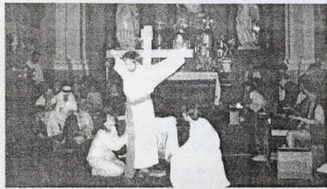
Predstavenie Prázdny hrob v podaní kapucínov z Bratislavy zaplnilo priestory kostola sv. Klimenta v Močenku.