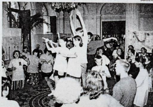
Účastníci tvorivej dielne predvádzajú v charitnom dome výsledky svojej štvordňovej práce.