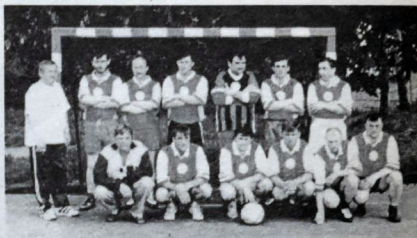
Najúspešnejšie mužstvo Interligy

Kontumácie: Janíkovec - Šahy 0:3, Vlčany - Janíkovec 3:0, Chynorany - Komárno 3:0, Chynorany - Marcelová 0:3, Janíkovec - Chynorany odrali tri body.