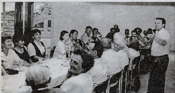
Návštevníci z Oravy obdivovali novootvorené priestory spoločenskej sály.