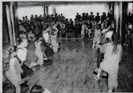
Vystúpenie súborov Jump a Močenečka rozlískalo preplnenú novootvorenú spoločenskú sálu. .

ŠTARTUJEME Č. A Z. JÚNA S DISKOTÉKOU N - RÁDIA, ŽIVÉ VYSTÚPENIE TANEČNEJ SLEUDINY JUMP E. FADÚCA NEVÁHAJTE - PRÍDITE!!! KAŽDÝ NEDEĽU JE V PREEVÁDZKE KAVIARNE SO ŽIVOU HUDBOU. ČARÁME NA VÁS V PREEFRÁŠNOM PROSTREDÍ NOVOOTVORENEJ TANEČNEJ A SPOLOČENSKEJ SÁLY!!!