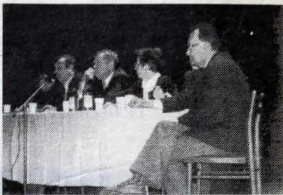
Členovia predstavenstva PD v Močenku