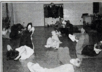
Aerobik matiek s deťmi

8.2.1997 /sobota/ 10,00 h kňazská vysviacka Svätiteľ - Mons. František Rábek, pomocný nitriansky biskup 9.2.1997 /nedeľa/ 10,30 h primičná svätá omša 15,00 h litánie s požehnaním