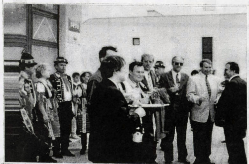
O dobrú náladu pri otváraní časti Zdrúženého objektu v Močenku sa postarala Folklórna skupina Močenčanka.