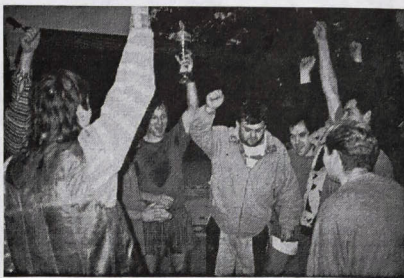
Čerství držiteľia Pohára starostu obce mužstvo Chelsea.

Ak má mať Interliga v Močenuku ďalšie pokračovanie, bude potrebné vyriešiť niekoľko otázok.