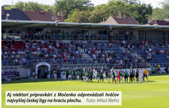
Aj niektorí prípravkári z Močenka odpreádzali hráčov najvyššej českej ligy na hraciu plochu.