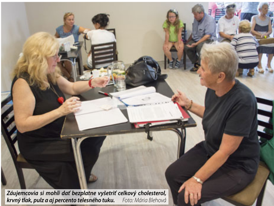
Záujemcovia si mohli dať bezplatne vyšetriť celkový cholesterol, krvný tlak, pulz a aj percento telesného tuku.

V tento deň si dalo zmerať cholesterol a krvný tlak 82 záujemcov, kde väčšina mala základné zdravotné parametre v norme alebo iba mierne zvýšené. Tým, ktorým namerali zvýšené hodnoty, pracovníčky odporučili navštíviť svojho praktického lekára a poradiť sa s ním o ďalšom postupe. Do poradenstva v rámci tohto podujatia zavítali najmä občania v strednom a vyššom veku. Najčastejšie sa pýtali, ako si ustriehnuť glukózu, cholesterol a krvný tlak. Tiež sa zaujímali o to, ako sa zdravo stravovať, a mali záujem aj o nutričné (výživové) poradenstvo. Okrem preventívnych vyšetrení občania dostali aj podporné materiály s odporúčaniami, ako sa starať