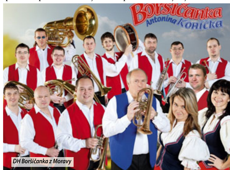
DH Boršičanka z Moravy

programu budú tiež výstavy, súťaž vo varení guláša a súťaž v pečení „Močenského smotankového koláča“. Popoludní sa predstavia súbory dospelých. O 18.00 h sa začne koncert Hudobnej skupiny Lekra. Po ňom bude nasledovať ľudová zábava za sprievodu moravskej Dychovej hudby Boršičan-