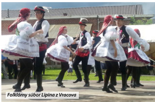
Folklorický súbor Lipina z Vracova