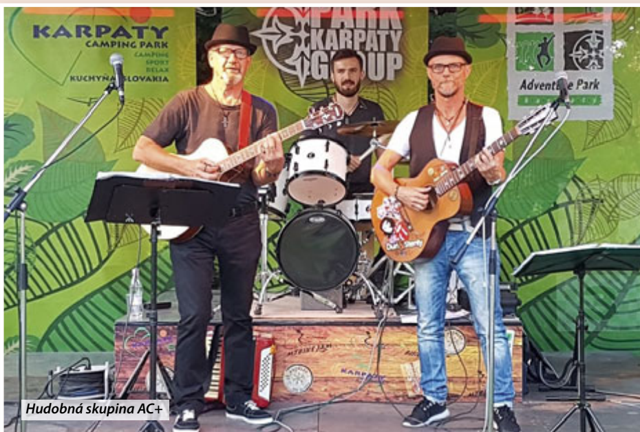
Hudobná skupina AC+

Obec Močenok Vás srdečne pozýva pri príležitosti sviatku Povýšenia svätého Kríža na XV. ročník Dní Obce Močenok 14. - 17. septembra 2017