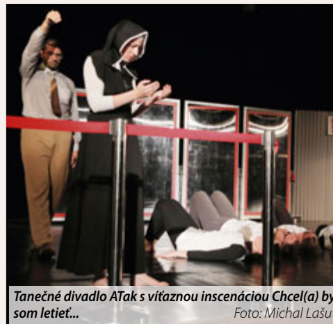
Tanečné divadlo ATak s víťaznou inscenáciou Chcel(a) by som letieť...