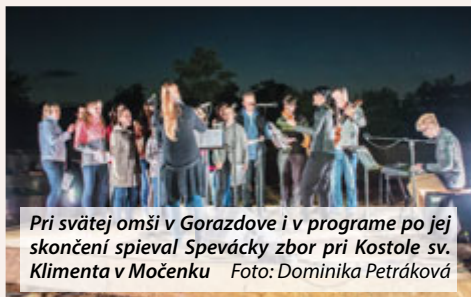
Pri svätej omši v Gorazdove i v programe po jej skončení spieval Spevácky zbor pri Kostole sv. Klimenta v Močenku

Druhé miesto získal detský divadelný súbor Úsmev pri ZŠ a MŠ Babín s predstavením O lietajúcej Alžbetke, ktoré re-