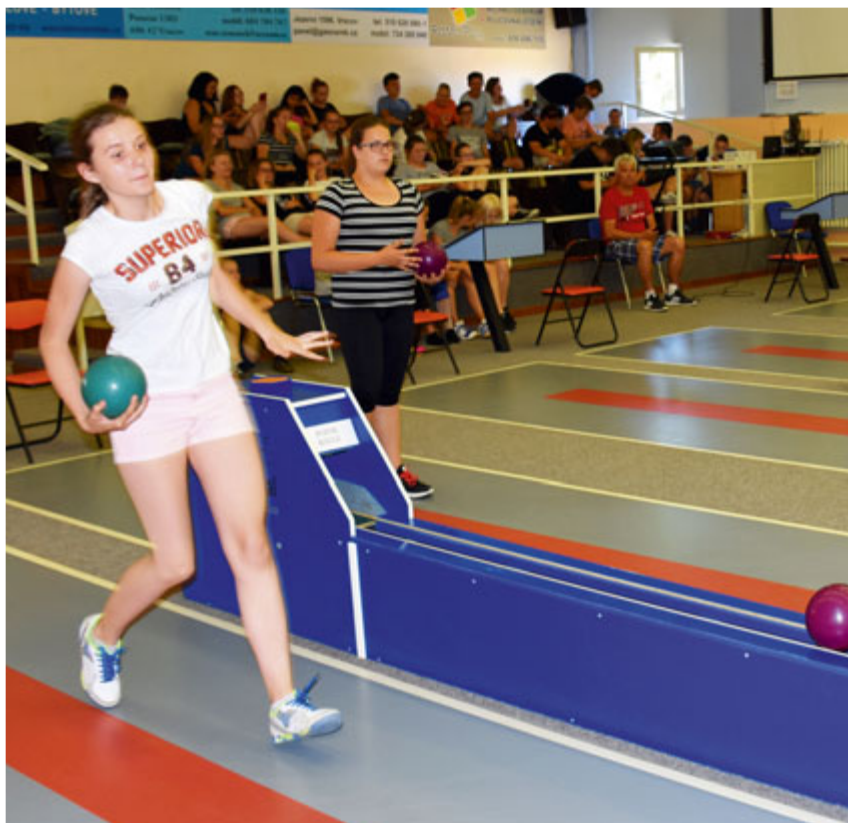
Základná škola Močenok a Masarykova základná škola Vracov nadviazali družbu. V júli vycestoval autobus žiakov, spolu s učiteľmi a riaditeľom z Močenku do Vracova. Prezreli si školu, zahrali si futbal a kolký.

Tel.: 0907/701497 , web: www.zuniga.sk e-mail: skola@zuniga.sk