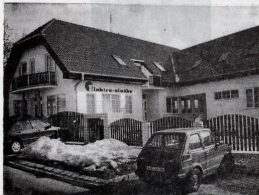
Sídlo firmy Elektro - služby.

Ďakujem za rozhovor a želim vám veľa úspechov pri rozvoji firmy Elektro - služby. Peter Sýkora