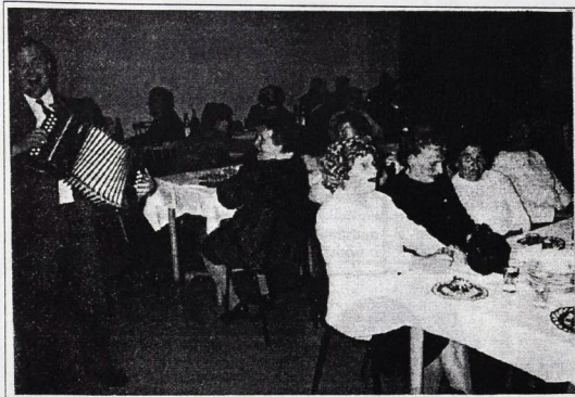
Pri oslave nechýbal spev a harmonikár - starosta obce