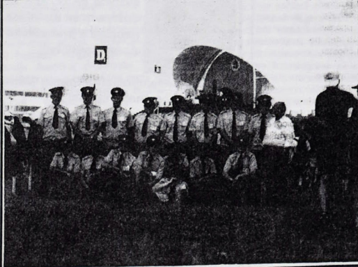
Príslušníci Dobrovoľného požiarného zväzu Močenok v úlohe usporiadateľov počas Stretnutia so Svätým otcom v Nitre.