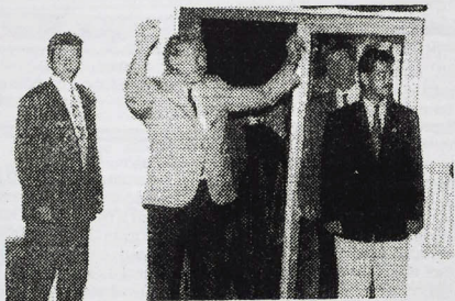
Ivan Gašparovič (v strede) pri vstupe do kinosály

Informačný a inzertný mesačník obce Močenok do 1 400 domácností