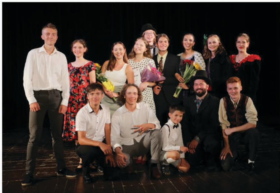
DS Za rohom - Prešov