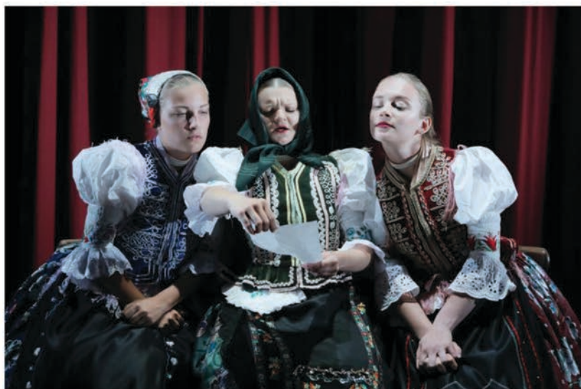
Tri sestry

Vo finále piatkovej súťažnej prehliadky sa mohli diváci ocitnúť priamo na javisku. Pre hru Tri sestry totiž využil divadelný súbor z Raslavíc priestor tzv. divadelnej arény. Diváci tak sedeli za zatvorenou oponou na javisku a celá dráma sa odohrávala v ich bezprostrednej blízkosti. Divadelný súbor Na skok nadväzuje na pevnú historickú tradíciu ochotníckeho divadla v ich obci. Svojou hrou nás vniesli do dedinského prostredia v čase vrcholiaceho vysťahovalectva. Hra inšpirovaná Čechovovou klasikou rozvíja tému bezmocnosti človeka v prúde neúprosného času, neschopného spraviť krok vpred.