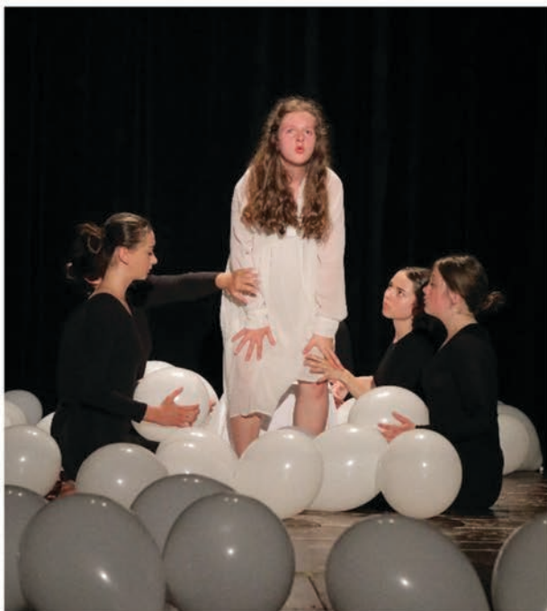
Dievča z morského dna