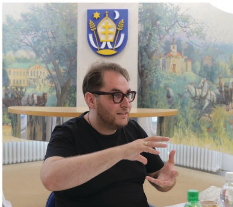
Marek Mokoš pri rozbere predstavenia