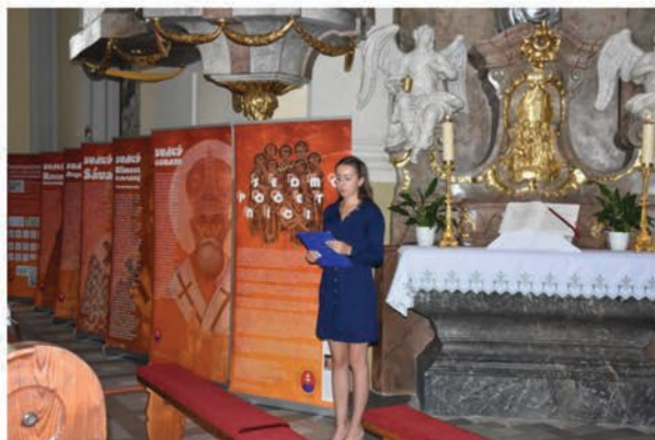
Otvorenie výstavy

Močenský filatelisti sa predstavili s príležitostnou poštovou pečiatkou a poštovými lístkami vyobrazujúcimi víťazný divadelný súbor vôbec prvého festivalu Gorazdov Močenok z roku 1993 – súbor Gorazd z Močenka. Okrem toho bol vydaný aj príležitostný lístok k 50. výročiu sviatosti kňazstva J.Ex. Františka Rábeka.