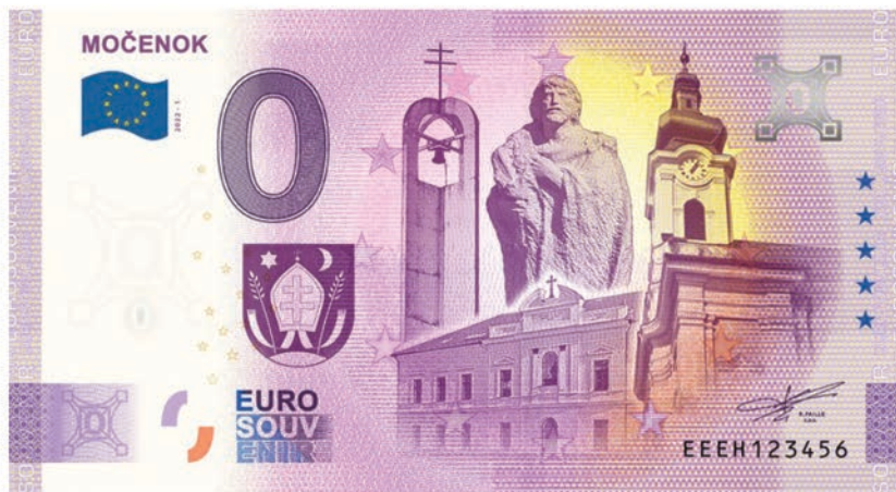
Euro souvenir MOČENOK

Močenok je historická obec, o ktorej sa prvá písomná zmienka datuje do roku 1113, kedy sa spomína v Zoborskej listine. Archeologické nálezy však dokazujú, že miesto, kde obec leží bolo obývané