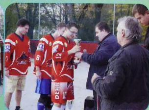
Finalisti 8. ročníka HbLPC